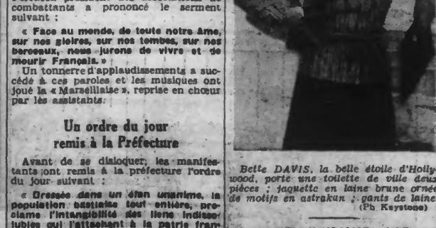
Belle DAVIS, la belle étoile d'Hollywood, porte une toilette de ville deux pièces : jaquette en laine brune ornée de motifs en astrakan ; gants de laine.