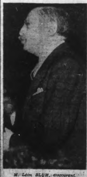
M. Léon BLUM, discoursant.

A SAINT-QUENTIN "ON A PRÊTÉ A LA GRÈVE DES INTENTIONS SUSPECTES QU'ELLE N'A PAS"... a déclaré M. Léon Blum au cours d'une réunion électorale