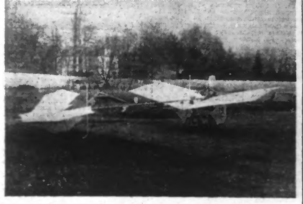
La « démolition » de SANTOS-DUMONT sur la pelouse de Bagatelle, le 23 Octobre 1906.

Chanute était alors avec lui le seul promoteur du mouvement. Très jeune, Octave Chanute quitta la France pour les Etats-Unis ; c'est là qu'il étudia