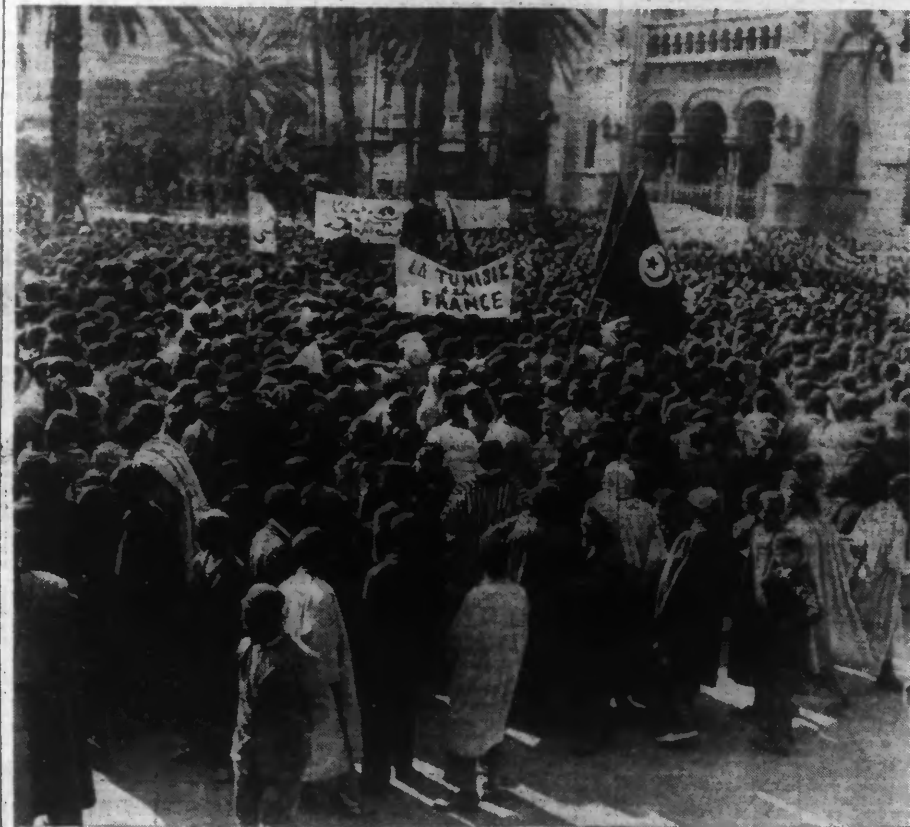
MANIFESTATION FRANCOPHILE A TUNIS.

Ajaccio, 4. — Des manifestations ont eu lieu ce matin dans de nombreuses localités pour protester contre les cris poussés à la Chambre italienne visant en particulier la Corse. Partout des ordres du jour ont été votés ; ils affir-