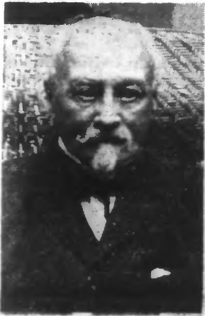
Octave CHANUTE, un des précurseurs de l'aviation.

Un très ancien rêve humain Le désir d'imiter les oiseaux dans leur vol s'est manifesté à travers tous les âges de l'histoire.