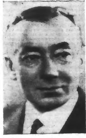
M. Paul REYNAUD Ministre des Finances

« Ni les sommations, ni les invites plus ou moins doucereuses ne me feront fléchir, surtout dans la situation actuelle... Le gouvernement continuera son chemin sans abdication, sans faiblesse », a déclaré M. Edouard Daladier qui a invité les élus à faire preuve du même courage et de la même fermeté qui animent le peuple de France