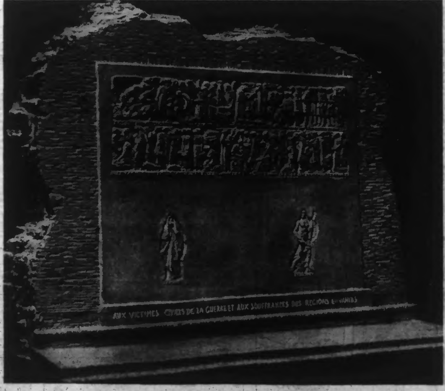
Ce matin, à PARIS, le sculpteur Félix DESREULLES présente officiellement au Ministre des Pensions et aux diverses autorités intéressées la maquette, dont il est l'auteur, du Monument National aux victimes civiles de la guerre et aux souffrances des Régions envahies. Ce monument doit être érigé à LILLE sur un terrain situé dans la rue Georges Lefebvre.