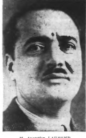
M. Augustin LAURENT Député du No. 6 (S. A. F. A. R.)

économique avait paru calmer certaines inquiétudes et rallier un grand nombre d'hésitants.