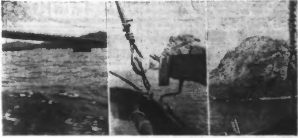
Les côtes Sud de l'Angleterre ont leurs mystères, terribles, impénétrables.

Face à la France, face à la Belgique, une invention mystérieuse, le « locator » qui vaut à la Grande-Bretagne d'être infestée d'espions, ne laisserait pas passer le « Channel » aux avions ennemis qui auraient échappé à notre D. C. A. régionale.