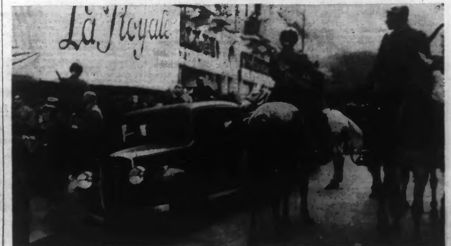
Le peuple tunisien prouve son attachement à la France par de significatives manifestations de rues. Vue prise sur une grande artère de TUNIS, où la Garde Mobile montée s'emploie à canaliser un fort contingent de manifestants.

L'auteur affirme : « Nous voulons et nous savons concilier nos intérêts nationaux avec les principes de la solidarité européenne et de la justice internationale alors que les Français s'obstinent d'autant plus à considérer comm. légitimes leurs droits et leurs prétentions que ceux-ci sont en opposition avec la justice et la solidarité internationale. »