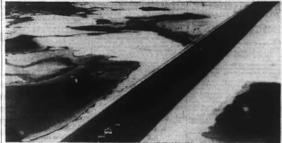
La Presse du CAIRE réplique aux revendications adressées par l'Italie à la France et à l'Angleterre, que le Canal de Suez est égyptien. Une vue du Canal de SUEZ.

La tactique italienne semble consister à rassurer l'opinion anglaise et à la convaincre que les aspirations de Rome ne menacent pas les positions de l'Angleterre en Méditerranée