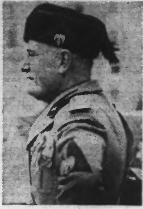
M. MUSSOLINI

Formidable détonation C'est une formidable détonation qui ébranla ce matin, à 4 h. 20, le quartier de l'église Notre-Dame-de-Joie. Sur une place publique, le monument de la Fédération bretonne-angevine venait de sauter. Dans la plupart des maisons d'alentour, les vitres furent brisées. On retrouva la statue de bronze représentant la liberté étendant ses ailes, brisée en plusieurs morceaux. La base de granit du monument avait résisté mais la colonne avait été ébranlée par la violence de l'explosion. Celle-ci avait été provoquée au moyen d'un cordon blackford de 5 à 6 mètres de longueur.