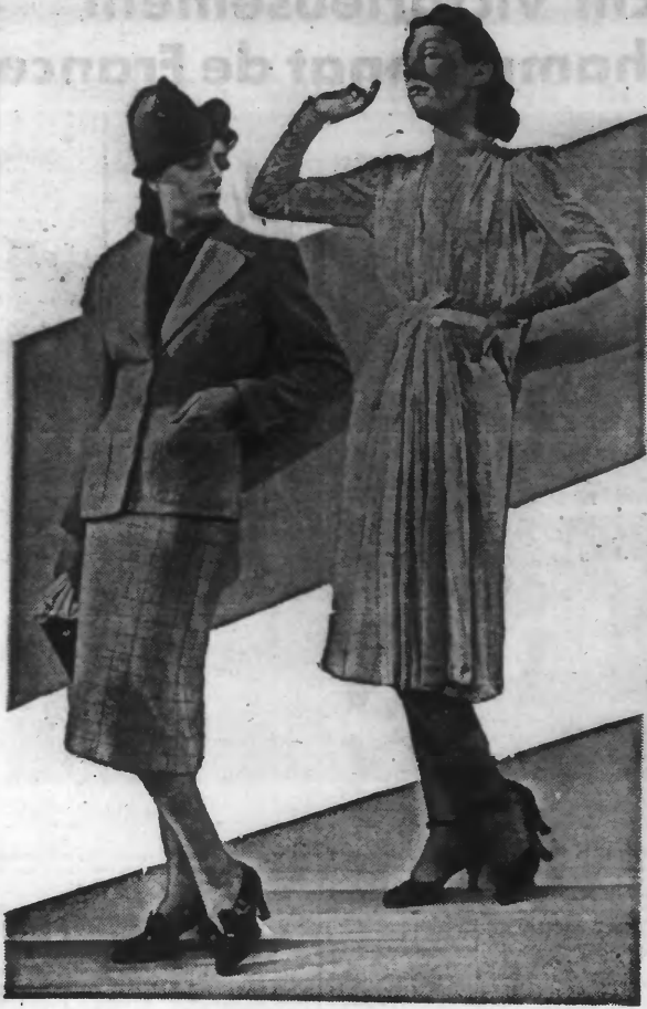
A gauche : Jupe à carreaux et jaquette noire. — A droite : Robe drapée en lamé, ceinture avec petit nœud plat.