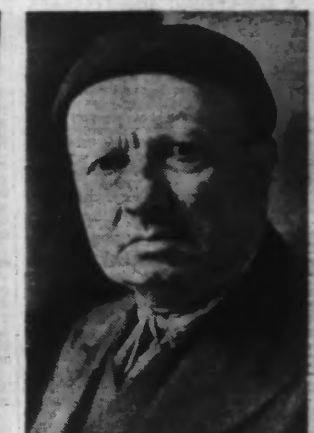
M. DE MONZIE, Ministre des Travaux Publics