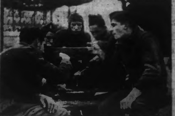
Il fait froid dans les tranchées des miliciens et la soupe chaude paraît bonne.

LES FRANQUISTES NE PARAISSENT PAS DISPOSÉS A DONNER LEUR ACCEPTATION A CE SUJET