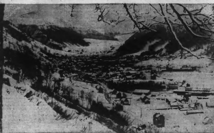
La neige en AUVERGNE. Voici une vue générale du MONT-DORE, recouvert d'un blanc manteau.

Presque partout dans notre pays, la température est tombée à moins de 10 degrés et la neige a fait son apparition