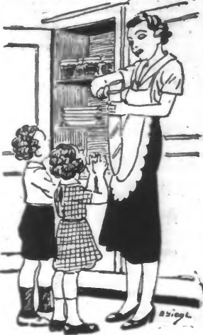
On donne des tartines aux enfants...

Depuis la découverte des vitamines, les physiologistes attachent à notre alimentation une importance considérable. Leurs anciennes conceptions ont été ébranlées. Avant, ils estimaient que, suivant son âge et son sexe, la ration journalière d'un individu devait se composer d'autant de grammes d'albumine, de graisse et d'hydrate de carbone, et il s'en tenaient là. La découverte des vitamines a prouvé que des produits naturels, jusqu'alors ignorés, étaient indispensables à la vie. Aussi, les savants se sont-ils mis à étudier passionnément la question de notre alimentation, afin de discerner ceux de nos aliments qui nous sont nécessaires et ceux qui nous sont nuisibles, et à rechercher s'il n'en existe pas dont les vertus sauvegarderaient notre santé et prolongeraient notre jeunesse et notre existence.