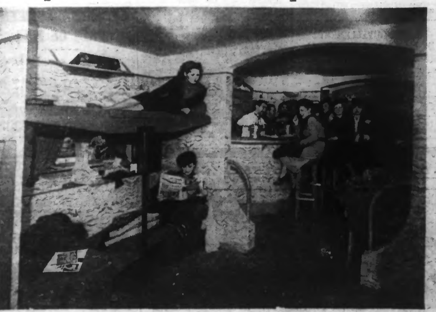
Le « ROCHAMBEAU », futur transatlantique de l'air de 68 tonnes, sera un gigantesque hydravion qui reliera la France à NEW-YORK en moins de 20 heures et offrira à ses 20 passagers toutes les commodités d'un véritable paquebot moderne. On voit ci-dessus les couchettes et lit de repos du « Rochambeau » et, dans le fond, le bar moderne qui sera de l'air, d'après la maquette.