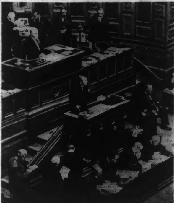
M. PAUL REYNAUD, ministre des Finances, prononçant son discours, hier matin, à la tribune du Sénat.

« IL FALLAIT CHOISIR ENTRE DEUX ROUTES : LA LIBERTÉ MONÉTAIRE OU LA CONTRAINTÉ. NOUS AVONS CHOISI LA PREMIÈRE, CAR LA SECONDE CONDUIT AU CONTRÔLE DES CHANGES QUI SERAIT IMPOSSIBLE A RÉSOUDRE AVEC UN PARLEMENT DÉMOCRATIQUE ».