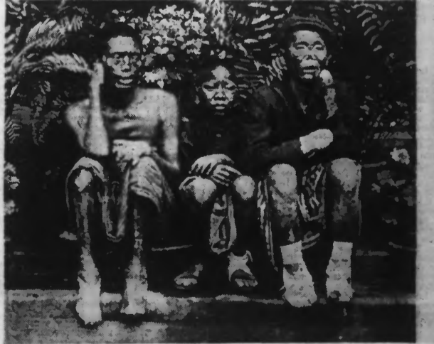
CHINOIS ATTEINTS DE LA PESTE.

L'épidémie, le Mexicain de la rappeur, diffère de l'endémie en ce que la première dépend d'une cause accidentelle et la seconde d'une cause habituelle, constante ou périodique. C'est ainsi que la peste est épidémique en Europe et qu'elle est endémique dans l'Inde.