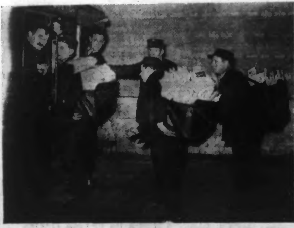
A l'occasion des fêtes de Nouvel-An, les postiers ont un surcroît de travail important. L'augmentation des tarifs postaux n'a pas empêché l'envoi massif des lettres de bonne année que nous voyons chaque année à cette époque. Voici des facteurs partant hier matin de la poste de la rue du Louvre, lourdement chargés.

Le départ des deux paquebots « SPHINX » et « CHANTILLY » de MARSEILLE, est retardé de deux jours par suite de l'embarquement à bord de deux bataillons de Trailleurs Sénégalais à destination de DJIBOUTI. Notre document représente des Trailleurs Sénégalais arrivant à MARSEILLE pour être embarqués à destination de DJIBOUTI.