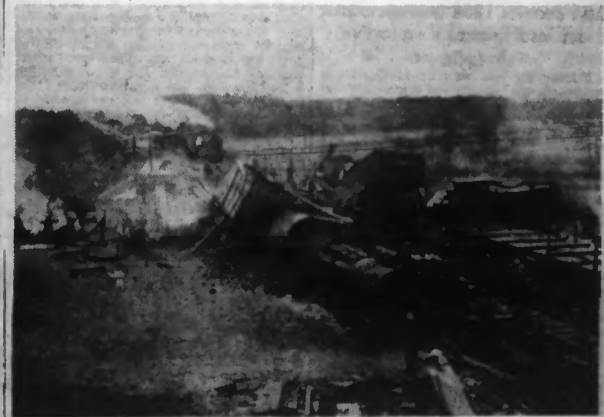
Une vue saisissante d'une catastrophe ferroviaire.

catastrophes locales antérieures, l'homme aurait dû fuir ces terres inhospitalières et non, par insouciance, s'exposant au retour de pareilles calamités.