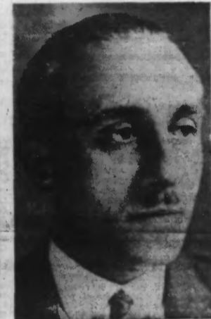
M. Gabriel PÉRI, Député de Seine-et-Oise.

des lois des 24 juin et 31 décembre 1936, sur les contrats collectifs de travail et l'arbitrage obligatoire.