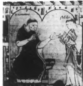
Deux des célèbres moines de St-Amand, au IX e siècle, d'après une miniature du temps: HUGOBALD et MILON, à qui Charles le Chauve confia l'édification de ses trois fils.

La vieille et pittoresque ville de Saint-Amand, un de nos plus charmants centres touristiques de la région du Nord, pourrait célébrer durant l'année qui va commencer l'anniversaire d'une date mémorable dans son histoire, celle de sa fondation.