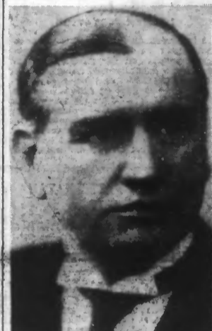
M. Edouard DALADIER

AU GROUPE RADICAL-SOCIALISTE LE PRÉSIDENT DU CONSEIL S'ÉTAIT MONTRÉ DISPOSÉ À APPORTER QUELQUES ATTÉNUATIONS A L'ART. 32 BIS ET AVAIT DEMANDÉ QU'UN EFFORT EXCEPTIONNEL SOIT FAIT POUR QUE LE VOTE FINAL INTERVIENNE AVANT SON DÉPART