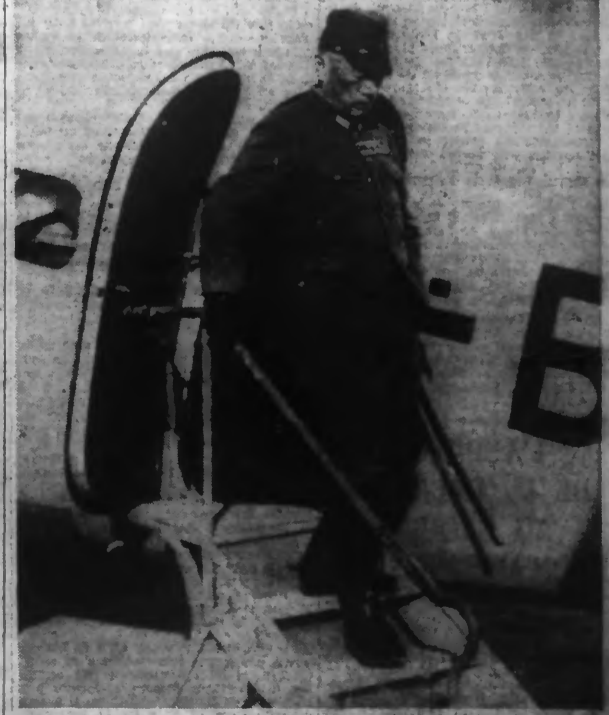
L'arrivée à l'aérodrome de Nankin du Général OURYOUNG TCHOUÏ, qui remplace le Général TERAOCHI, comme commandant en chef des troupes japonaises en Chine septentrionale.

LA DÉCLARATION DE M. OUANG TCHENG OUEI FAIT ÉMETTRE CETTE HYPOTHÈSE DANS CERTAINS MILIEUX