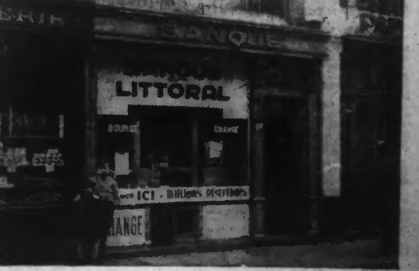
La Banque du Littoral, 15, rue du Président Poincaré, à DUNKERQUE, qui a été cambriolée.

LES MALFAITEURS, QUI DOIVENT APPARTENIR A UNE BANDE INTERNATIONALE, PÉNÈTRÈRENT PAR EFFRACTION DANS LES LOCAUX OÙ ILS DÉROBÈRENT UN COFFRE-FORT CONTENANT 25.000 FRANCS, PUIS PRIRENT LA FUITE EN AUTOMOBILE