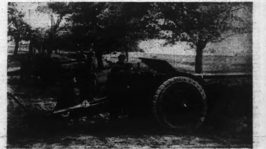
ARTILLERIE TCHÉCOSLOVAQUE EN ACTION.

Il y a neuf morts du côté hongrois, les Tchèques en ont laissé cinq sur le terrain, mais en ont emporté d'autres