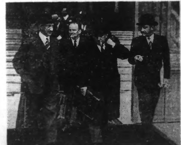
Voici, photographiés à l'issue du Conseil, MM. Georges BONNET, Ministre des Affaires Étrangères, Edouard DALADIER, Président du Conseil, Ministre de la Défense Nationale et Guy LA CHAMBRE, Ministre de l'Air.