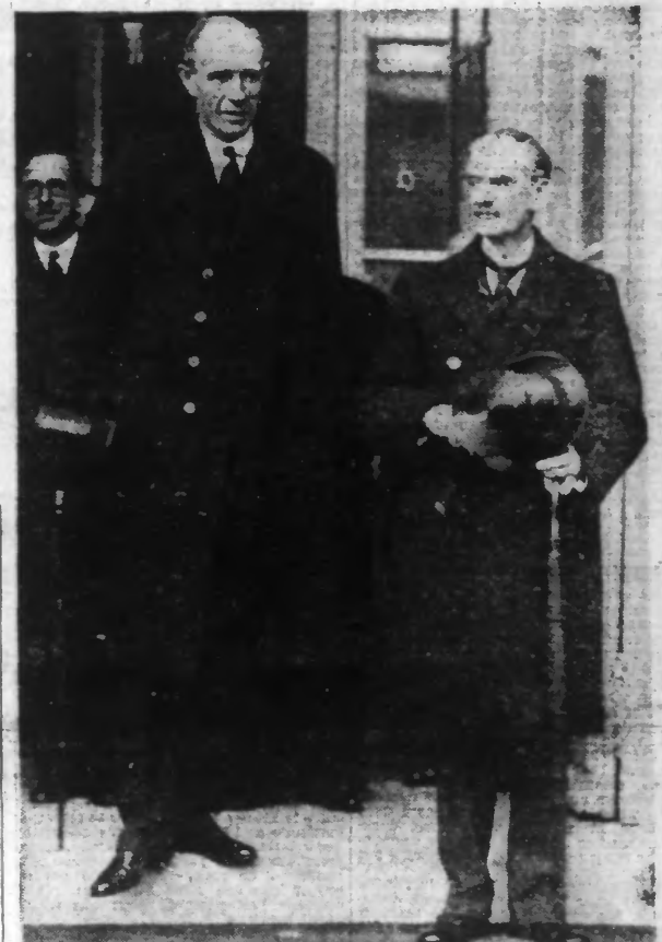
Lord HALIFAX et M. Neville CHAMBERLAIN, à leur départ de LONDRES

Londres, 10. — Le premier ministre qui avait quitté Downing-Street à 10 h. 51 pour la gare Victoria, a été acclamé dans White Hall par une foule compacte que la police avait empêché de stationner dans Downing-Street même pour éviter les manifestations des chômeurs. A son arrivée à la gare, en compagnie de lord Halifax, le chef du gouvernement a été salué par les acclamations.