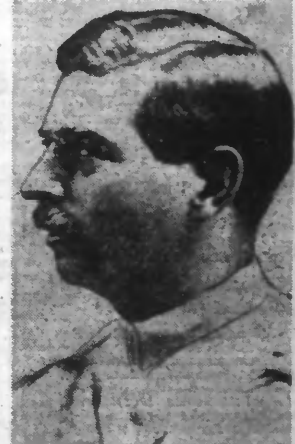
Le Roi CAROL

Les milieux officiels, cependant, opposent un démenti catégorique à toute information concernant un complot. Ils reconnaissent, néanmoins, que des dispositions spéciales de police ont dû être prises et un certain nombre d'arrestations opérées. Cet état d'alerte policière est la conséquence des événements des dernières semaines. La mort de Codreanu et de ses coaccusés a mis un terme à l'agitation terroriste développée par les anciens membres de la « Garde de Fer » et leurs inspirateurs étrangers.