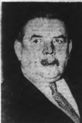
M. HERRIOT qui a été réélu Président de la Chambre

M. Edouard HERRIOT a été réélu Président de la Chambre