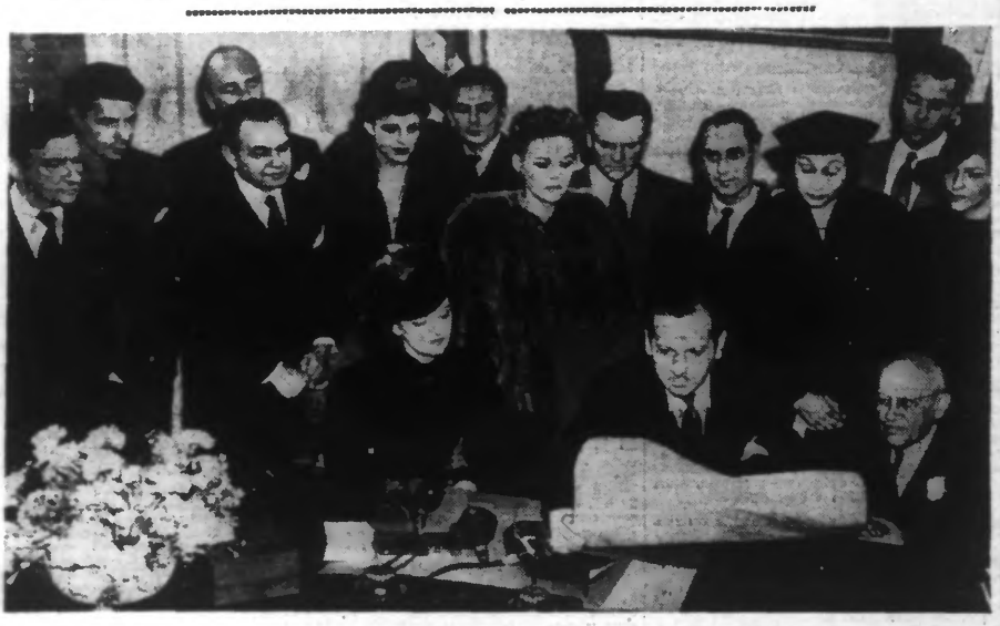
Un Comité composé de toutes les célébrités de l'écran américain, réuni à Hollywood, vient de signer un manifeste retentissant demandant le boycott économique de l'Allemagne nazie.