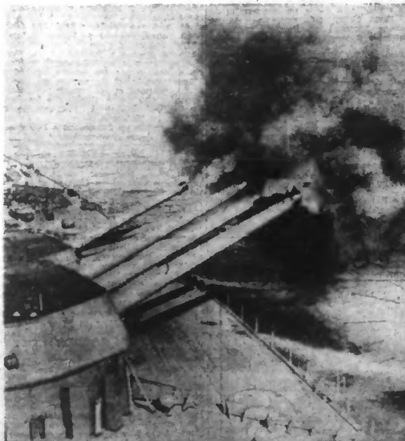
La croisière de printemps de la « Home Fleet » commencera dans le courant du mois de janvier. Ci-dessus des canons du navire de guerre « H.M.S. Nelson », en plein tir.