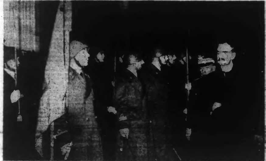
M. CHAMBERLAIN passant en revue une garde d'honneur italienne.

LE PREMIER BRITANNIQUE QUI A QUITTÉ ROME A 12 HEURES 05 ARRIVERA CE MATIN A PARIS OU IL AURA DANS SON WAGON UN ENTRETIEN AVEC SIR ERIK PHIPPS