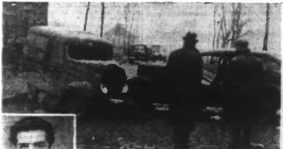
Les deux autos obstruant entièrement la route (photo prise à la minute même de la rencontre, alors qu'on transportait les blessés). — A gauche : le plus grièvement atteint des accidentés : M. Robert COLLORIDJ.