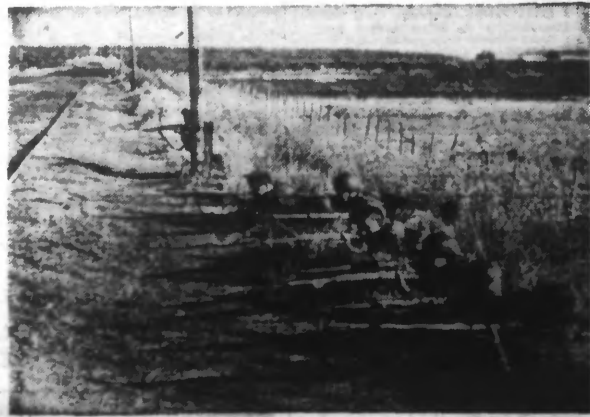
Gouvernementaux défendant une voie ferrée sur la deuxième ligne de défense de BARCELONE.

Le Conseil de la S. D. N. a voté une résolution condamnant les bombardements aériens des populations civiles espagnoles