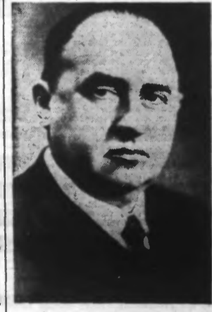
Le Docteur FUNK

Le D r Schacht demeure membre du gouvernement allemand en qualité de ministre