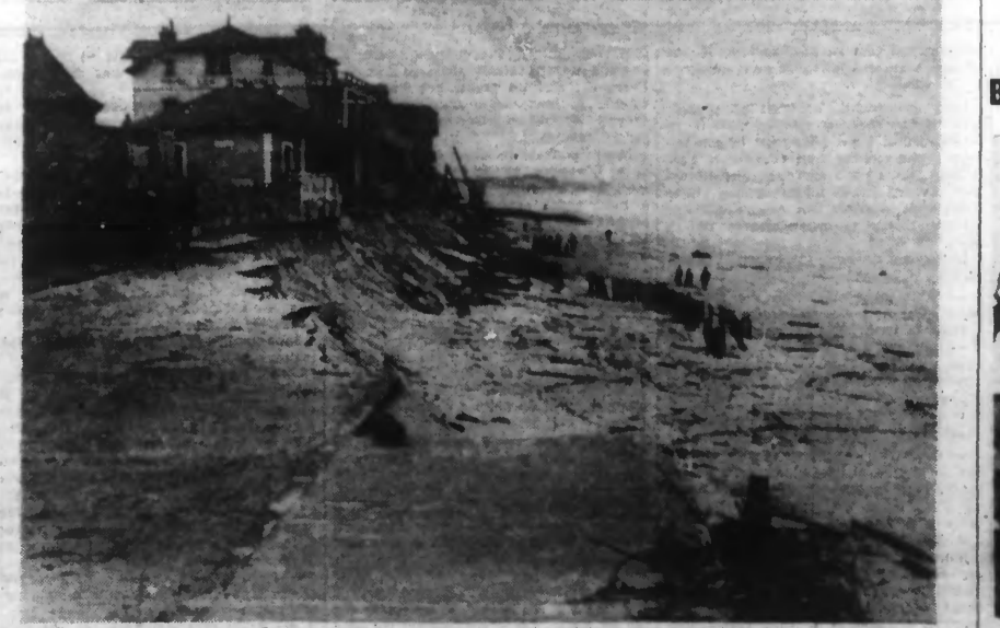
Trente-cinq maisons et villas de SAINT-JEAN DE LUZ ont été détruites par la mer, qui ronge la côte de plus en plus. Voici quelques-unes des maisons qui sont menacées d'engloutissement d'un moment à l'autre.