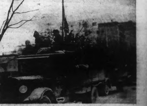
Troupes gouvernementales traversant BARCELONE en camions pour aller relever les miliciens de premières lignes.