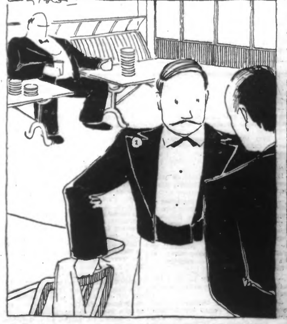
— 63 ans ! — — Quand il fut assis de ses, il était champion de descente.

Lire en huitième page : Le « JOYEUX RÉVEIL ».