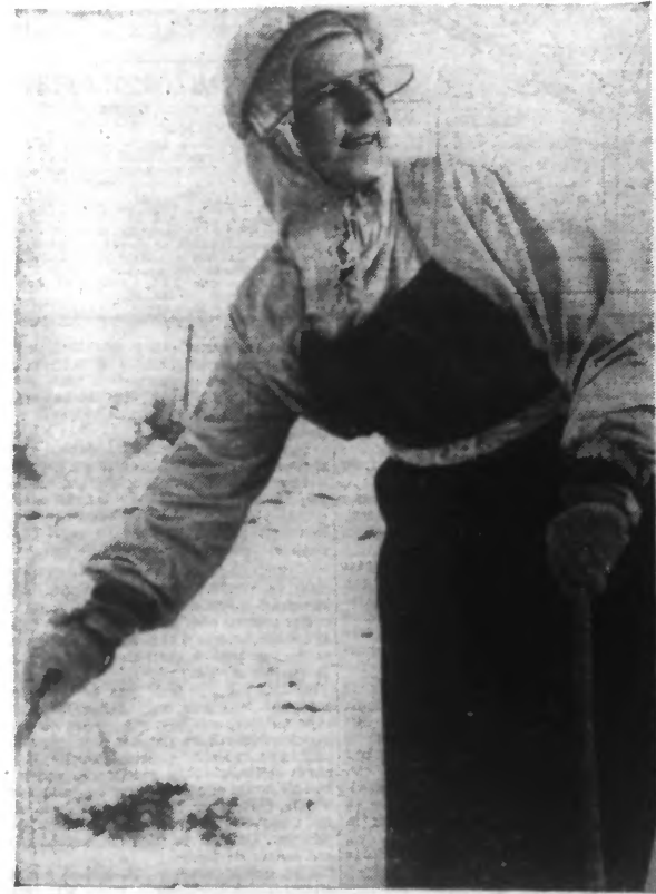
Capuchon et visière, et cette jeune skieuse ne craint ni le froid ni le vent... tout est restant gracieux.

Lire en huitième page : notre « PAGE FÉMININE ».