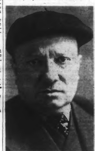
M. DE MONZIE.