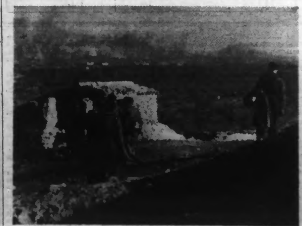
Sur le front du Nord, en Catalogne, les soldats franquistes assistent au bombardement des positions adverses par leur aviation.

IL N'Y A PLUS MAINTENANT DE LIGNE FORTIFIÉE GOUVERNEMENTALE PROTÉGANT LA CAPITALE DE LA CATALOGNE