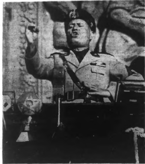
Une attitude de M. MUSSOLINI, discourtant.

...déclare M. Mussolini devant plusieurs milliers d'agriculteurs réunis à Rome, au Théâtre Adriano