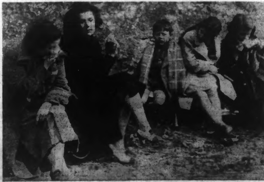
Après être entrées en France par la frontière du Perthes, des Catalanes pleurent leur foyer perdu tandis que les enfants se restaurent. (Par Radiogramme Nyl)

L'exode vers la France des populations catalanes prend un rythme accéléré