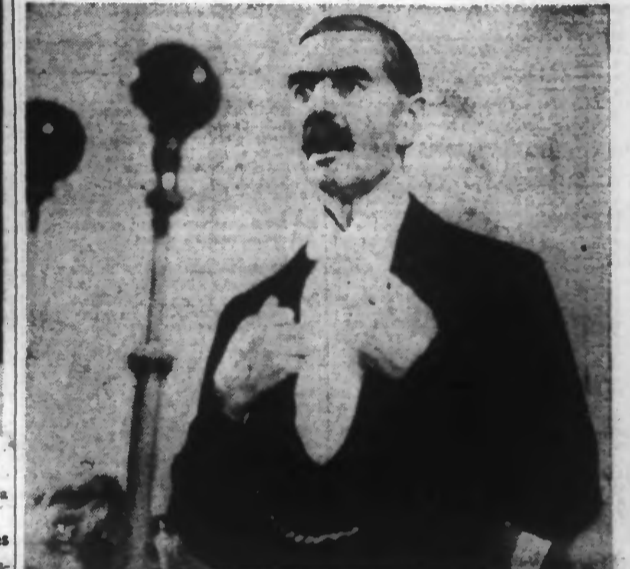
M. Neville CHAMBERLAIN discourt.

« C'EST SEULEMENT EN TEMPS DE PAIX QUE L'ATTENTION PEUT ÊTRE CONSACRÉE A L'AMÉLIORATION DES CONDITIONS DE VIE DES POPULATIONS... — JE CROIS QUE TOUS LES GENS DE CŒUR, DANS TOUS LES PAYS, SE JOINDRONT AUX EFFORTS QUE JE FAIS POUR ÉVITER LA GUERRE »