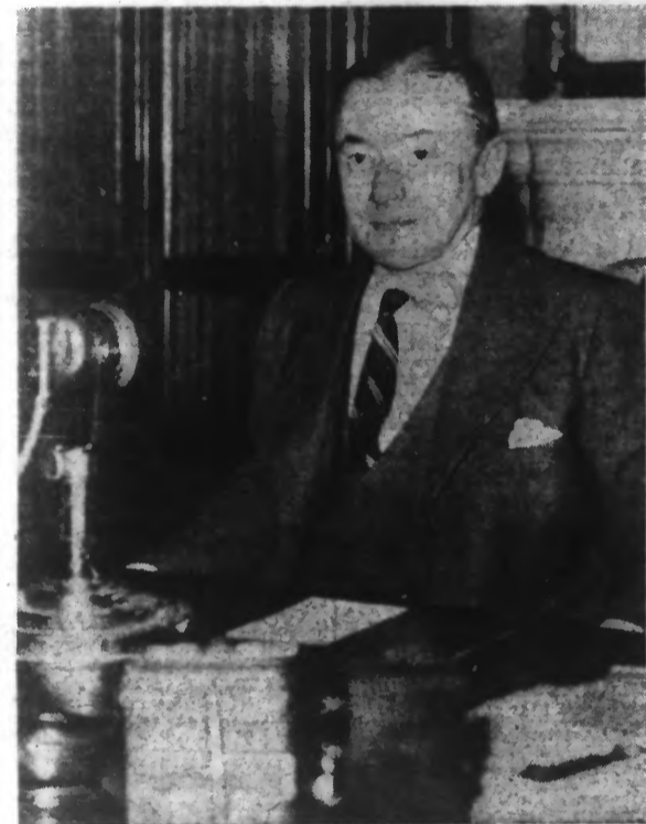
M. Paul REYNAUD devant le-micro.

a déclaré le ministre des Finances qui, dans un discours radiodiffusé, a montré que la situation financière et économique du pays s'est grandement améliorée au cours du dernier trimestre