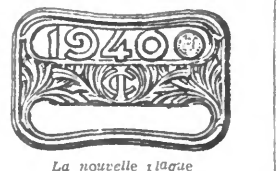
La nouvelle plaque