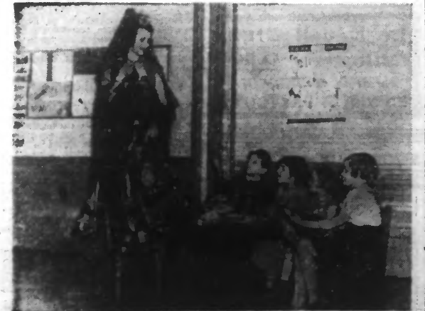
La célèbre actrice a donné une représentation à NEW-YORK pour les enfants malheureux. Elle avait posé devant quelques-uns d'entre eux dans son costume de « Rouine », du « Barbier de Séville », ainsi que le montre notre photographie.

Lire en huitième page : notre « PAGE FÉMININE ».