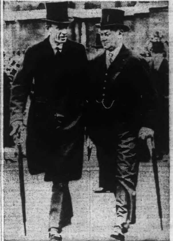
Lord HALIFAX (à gauche) s'entretenant avec Sir Thomas INSKIP.

SIR REGINALD DORMAN SMITH devient Ministre de l'Agriculture et LORD WINTERTON devient Upaymaster General