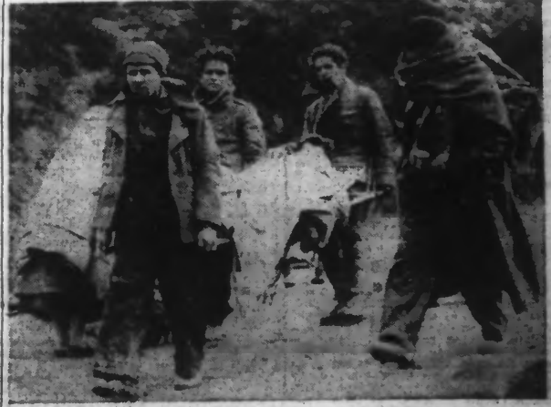
Les miliciens blessés, dès leur arrivée en France, sont dirigés sur FRATS DE MOLLO. Ce sont leurs camarades, comme le montre notre photo ci-dessus, qui se chargent de les transporter.