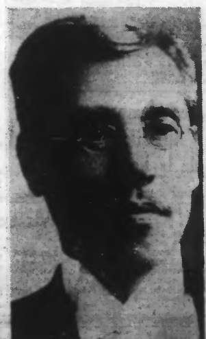
Le Baron HIRANUMA Président du Conseil des Ministres du Japon.

D'IMPORTANTES CONVERSATIONS DANS CE BUT auraient lieu depuis quelque temps entre les représentants de l'Allemagne, de l'Italie et du Japon.