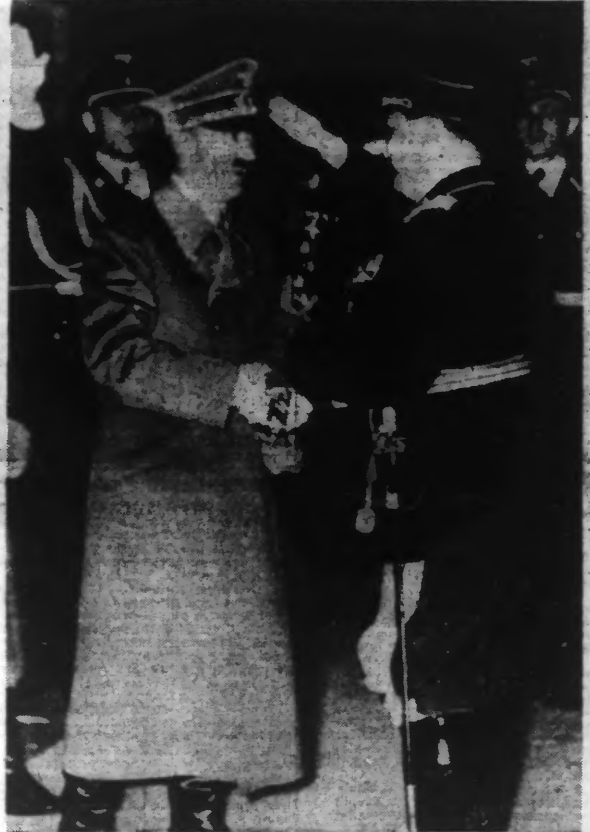
Le Chancelier HITLER s'entretenant avec le Maréchal GOERING.

de longs commentaires dans ce sens. Dans le « Volkischer Beobachter », le docteur Wilhelm Frick, ministre de l'Intérieur, déclare que « Adolf Hitler ne se laisse pas dicter par d'autres le moment où il a l'intention de prendre des décisions historiques. Il souligne qu'aujourd'hui, après la création du grand Reich, il convient d'assurer les fruits de la victoire. » Le « Lokal Anzeiger » écrit : « L'Allemagne est ressuscitée sous son Führer et aucune puissance au monde ne pourra arrêter la volonté du peuple de quatre-vingt millions d'hommes unis sous Adolf Hitler. » Le « Berliner Tageblatt » déclare : « 1939 ne sera pas seulement consacré à conserver les conquêtes. On verra aussi à compléter intérioritément l'œuvre de l'union allemande en effaçant peu à peu les cicatrices des séparations historiques. »