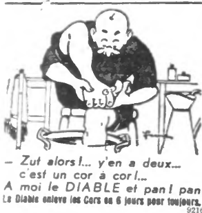
Zut alors!... y'en a deux... c'est un cor à cor!... A moi le DIABLE et pan! pan Le Diablot envoie les Cors en 6 jours pour toujours.