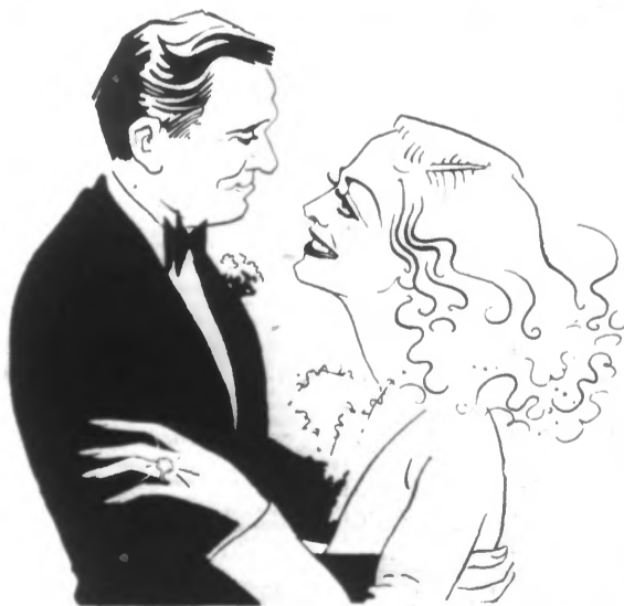
Joan CRAWFORD dans un de ses films, avec Spencer TRACY. (D'après un dessinateur d'Hollywood)

tout le monde, pendant quelques secondes, alors que Joan Crawford tarda à réapparaître selon le temps qui avait été prévu.