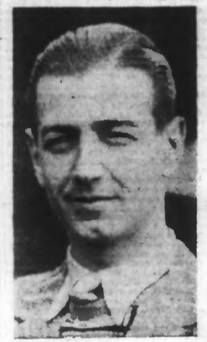
Un portrait du pilote Yves RIPAULT, qui a trouvé la mort dans l'accident.

C'est d'une hauteur de cinq mille mètres que l'avion s'abattit sur le sol et cette chute serait due au mauvais temps et au givrage.