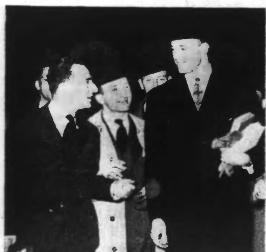
L'ARRIVÉE DE JAMES ROOSEVELT A PARIS. - M. James Roosevelt, arrivant à la gare du Nord, a été reçu par les personnalités de la colonie américaine de Paris. (M. Roosevelt est à droite).