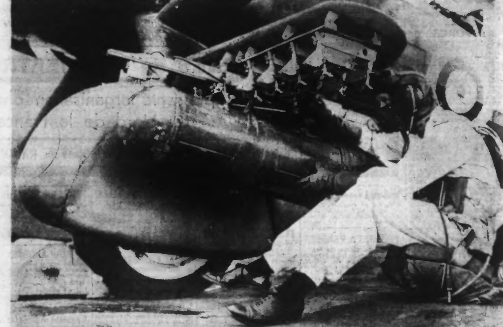
PROJECTILE INOFFENSIF. - Au cours de manœuvres de l'aviation britannique à Hawkinge, dans le Kent, un aviateur fixe sous son avion non pas une torpille mais un réservoir à vivres qui sera lâché à un certain endroit pour ravitailler une colonne d'infanterie.