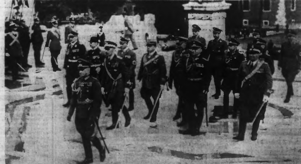
LE SÉJOUR A ROME DU GENERAL WALTER VON BRAUCHITSCH, COMMANDANT DES ARMÉES ALÉMANDES. - Le général Von Brauchitsch suivi de son état-major et de personnalités militaires italiennes a déposé une couronne au Monument du Soldat Inconnu Italien.