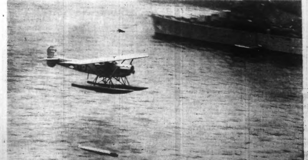
MANŒUVRES DE LA FLOTTE HOLLANDAISE. - Au cours des manœuvres de la flotte hollandaise à l'embouchure de la Meuse, l'hydravion G-1 lâche une torpille dans le cours du fleuve.