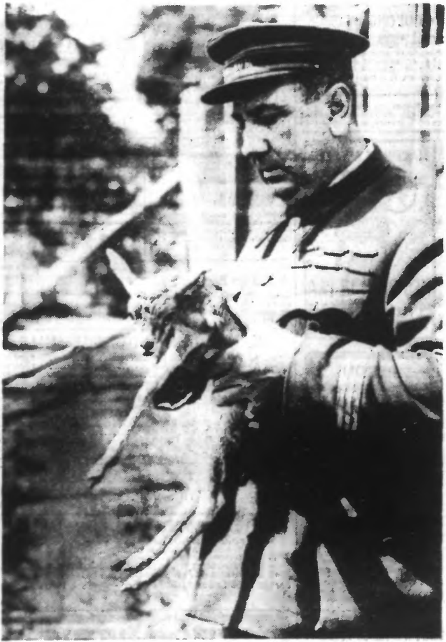
UNE GAZELLE DE DEUX HEURES. — Voici au Zoo de Vincennes le gardien-chef, tenant dans ses bras une gazelle de Perse qui vient de naître, court déjà et n'a que deux heures.