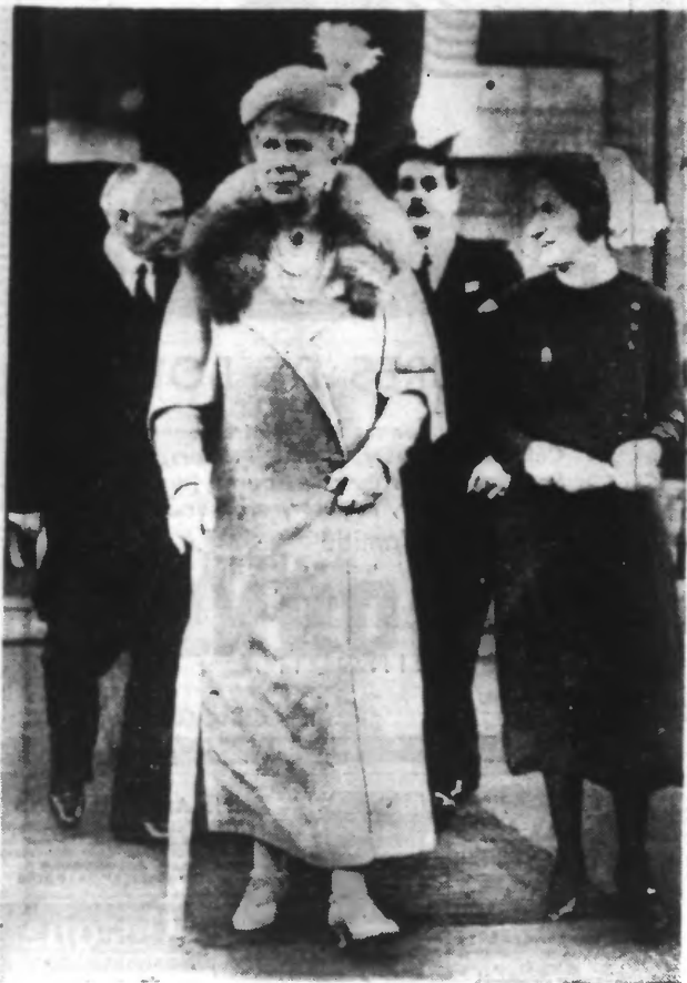
LE 72 ème ANNIVERSAIRE DE LA REINE MARY. — Une récente photographie de la Reine Mary dont le 72 ème anniversaire fut fêté le 26 Mai.