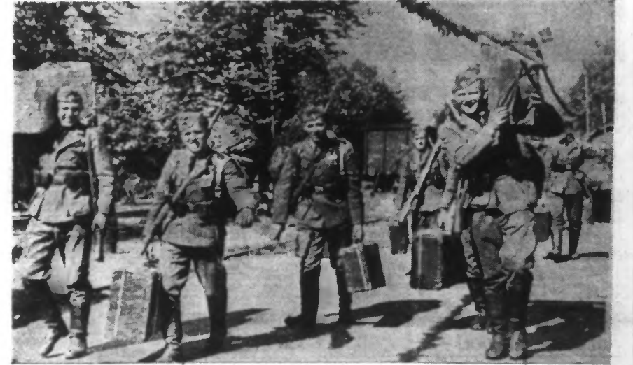
Legionnaires allemands se rendant au port de VIGO où ils se sont embarqués pour HAMBOURG.

A Hambourg, ils ont salué le ministre Goering qui a répondu en levant son bâton de maréchal