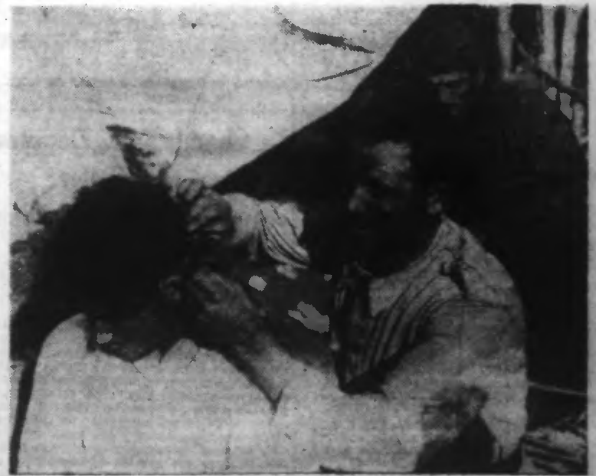
Miliciens espagnols à leur toilette.

Et l'on n'a, nous a-t-on dit, que des éloges à décerner à ces hommes qui se montrent ouvriers consciencieux et actifs