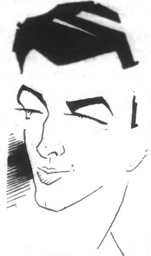
ROBERT TAYLOR beau héros de « La Foule en délire ».

Richard Thorpe, metteur en scène du film M. G. M. « La Foule en délire », qui passe actuellement sur un écran parisien, a souvent déclaré, depuis qu'il a eu l'occasion de tourner avec Robert Taylor, qu'il était le travailleur le plus consciencieux qu'il ait jamais rencontré à l'écran. « Si j'ai voulu tenir un rôle de pilote, dans un film d'aviation, dit-il, je suis persuadé que Taylor tiendrait à obtenir, auparavant, sa licence. Contrairement à de nombreux acteurs satisfaits de pouvoir faire des gestes qui correspondent apparemment à la réalité, Taylor