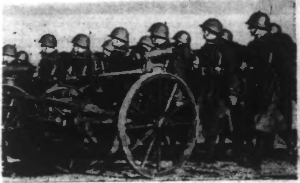
Voici, au cours des manœuvres polonaises à la frontière allemande, le défilé d'une compagnie de mitrailleuses.

CEPENDANT, LA RÉPONSE SOVIÉTIQUE EST ATTENDUE AUJOURD'HUI A PARIS, OU L'ON ESTIME QU'UN ACCORD COMPLET NE SAURAIT TARDER