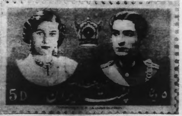
Les Postes de l'IRAN viennent d'émettre un timbre portant l'effigie du Prince héritier d'IRAN et de la Princesse FAWZIA.