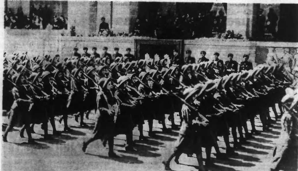
70.000 FEMMES FASCISTES DÉFILENT DEVANT LE DUCE. — Arme sur l'épaule, les jeunes filles des organisations coloniales italiennes défilent devant M. Benito Mussolini, sur la voie de l'Empire.