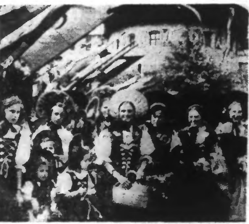
LE LICHTENSTEIN ACCLAME SON NOUVEAU PRINCE. — Le peuple du Liechtenstein a acclamé le Prince François-Joseph II, son nouveau souverain, qui a pris officiellement le pouvoir. Voici la foule bariole et très colorée locale, assemblée avec des drapeaux devant le château de Vaduz.