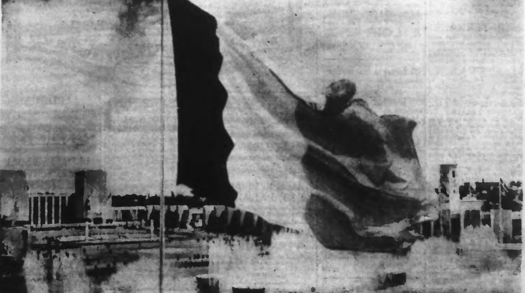
LES TROIS COULEURS FRANÇAISES SUR LA WORLD'S FAIR. — Dominant les jets d'eau de l'allée centrale de l'Exposition new-yorkaise, le drapeau français flotte au vent.