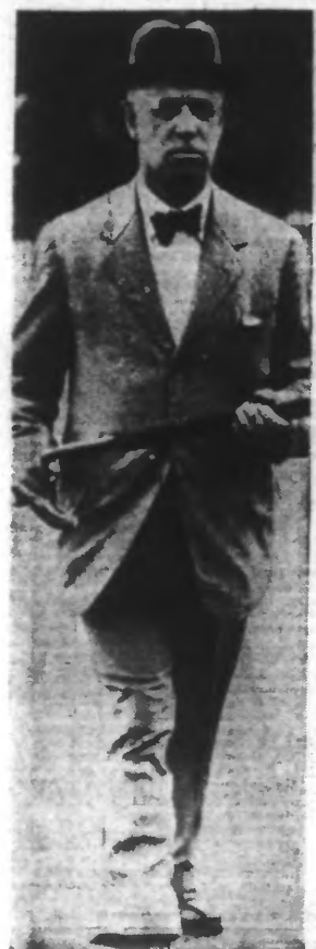
Lord PERTH qui est chargé de la propagande par ondes.

(De notre Correspondant particulier : GERARD BOUTELLEAU).