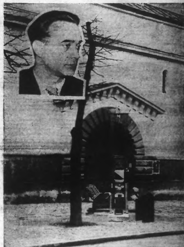
La guillotine montée devant la prison de VERSAILLES et à gauche : la tête du tueur.