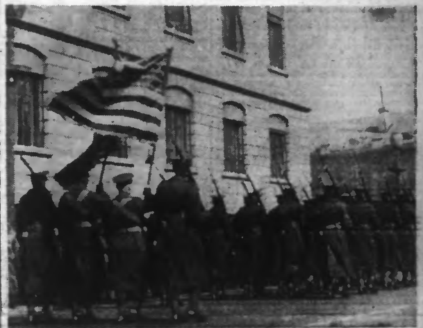
Un défilé de la garnison américaine dans la concession internationale de TIEN-TSIN.

« Le point crucial du problème réside dans un renoncement formel à la politique pro-chinoise de la Grande-Bretagne », a déclaré le commandant de la garnison nipponne de Tien-Tsin