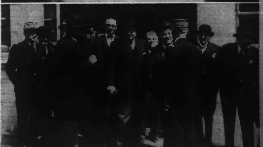
EN HAUT : M. DE MONZIE coupe le ruban représenté par une pièce de dentelle. — EN BAS : Le Ministre des Travaux Publics, entouré de ses collaborateurs, sur le quai de la Gare.

(LIRE NOTRE COMPTE RENDU EN DEUXIÈME PAGE)