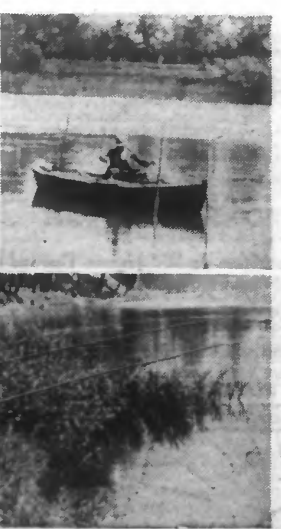
Pêcheurs sur hier matin au poissonneux lac du QUESNOY : Celui-ci bien installé sur la rive, pour qui la journée de pêche est repos et détachement et, dans sa barque où il restera douze heures attentif et immobile, le bras levé de la gaule.

Cette seule journée du 17 juin dura plus qu'une année de purgatoire pour tous les fervents chevaliers de la gaule qui virent défiler des minutes « minutes » comme des heures, qui dans leur magasin, qui au bureau ou à l'atelier. Pendant ce temps, d'autres, plus favorisés, réalisaient ce rêve merveilleux caressé depuis le jour lointain ou un arrêté préfectoral a interdit d'aller taquiner le goujon : l'Ouverture.