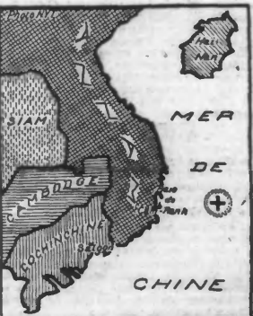
Voici une carte sur laquelle une croix indique l'emplacement exact où le sous-marin effectua la plongée à la suite de laquelle il ne reparut pas à la surface.

La ville de Saigon a appris ce matin seulement la catastrophe que l'Amirauté n'a voulu rendre publique que lorsqu'il estimait qu'il ne restait plus aucun