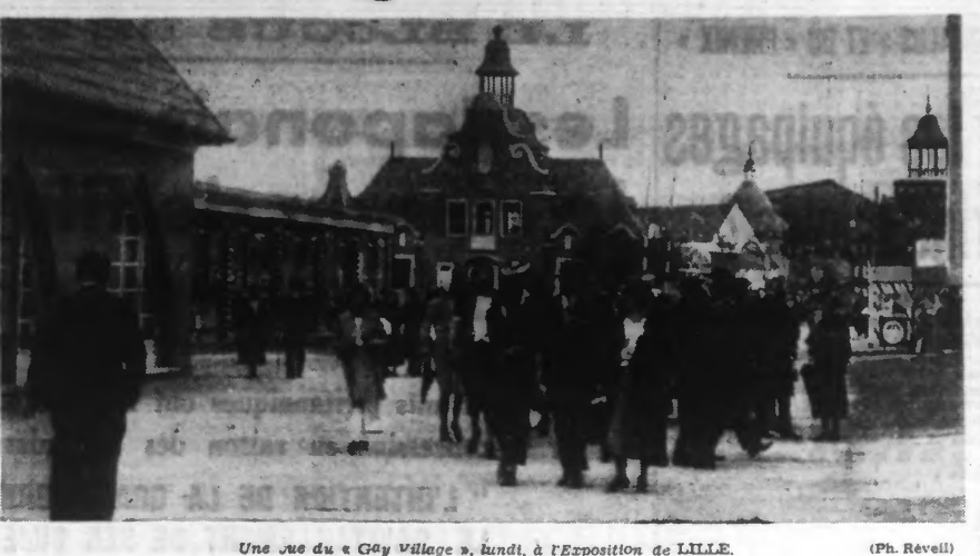
Une vue du « Gay Village », lundi, à l'Exposition de LILLE.