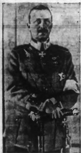
Le Maréchal MANNERHEIM, chef de l'armée finlandaise, qui a donné sa démission de Président du Conseil de la Défense Nationale.

LA CLIENTÈLE ÉLÉGANTE SE RÉUNIRA DATER DU 24 JUIN AUX THÉS ET DINERS D'ÉTÉ AU RESTAURANT DES NATIONS