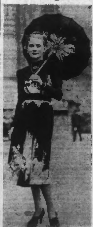
Une fête de l'Élégance vient d'avoir lieu à Paris. Notre photo montre une élégante qui obtint un légitime succès.