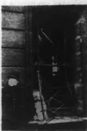
Une vue des dégâts causés dans la Banque de Aldwych Strand.

A ce même moment, une bombe éclatait à Aldwych, à environ un demi-kilomètre dans les deux cas, la bombe avait été placée aux abords d'une banque, deux succursales de la Lloyds Bank. Une demi-douzaine de personnes qui à Aldwych, à la sortie des théâtres,