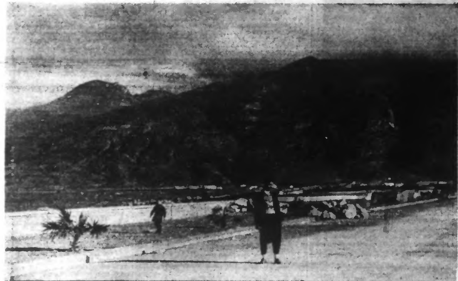
On voit qu'une des clauses de l'accord franco-turc prévoit la cession du San Iyok d'Alexandrette à la Turquie. En revanche, celle-ci renonce à ses visées territoriales sur la Syrie. Voici une vue d'Alexandrette.