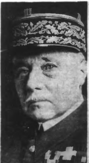
Le Général GAMELIN

a déclaré le général Gamelin qui présidait les fêtes commémoratives d'hier