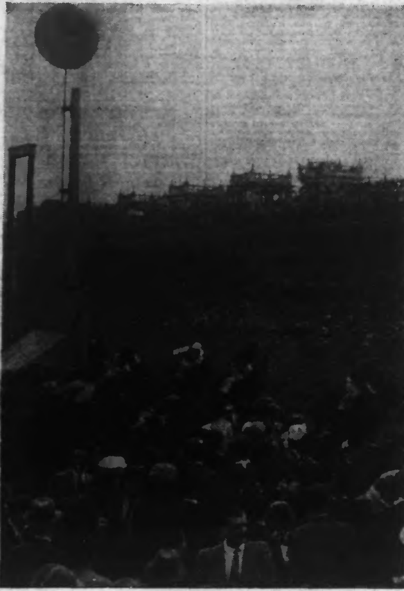
Une belle arrivée de course à l'Hippodrome de Longchamp.

Tous les Billets se terminant par 36 gagnent chacun MILLE FRANCS