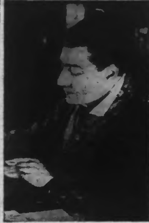
M. SACHA GUITRY