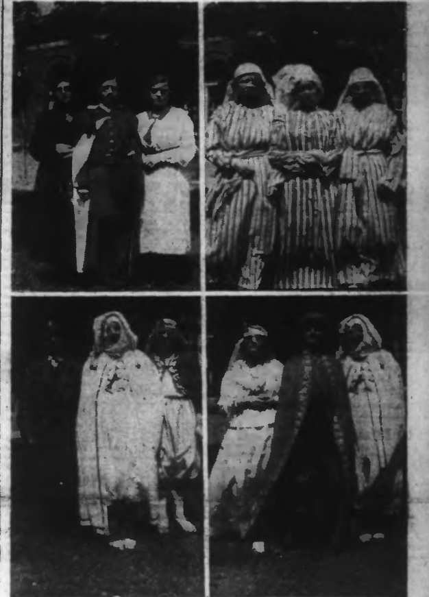
Quatre tableaux de la pièce marquée jouée par les pensionnaires de l'établissement psychiatrique de SAINT-VENANT.

LES PENSIONNAIRES ONT ASSISTÉ A UNE REPRÉSENTATION THÉÂTRALE : UN DRAME EN 3 ACTES ET UNE OPÉRETTE EN 2 ACTES JOUÉS ET CHANTÉS PAR LA TROUPE ARTISTIQUE DE L'ÉTABLISSEMENT