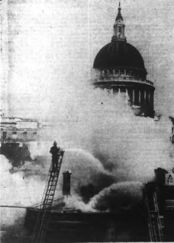
Les pompiers combattent le feu. Au second plan, la cathédrale Saint-Paul.

LES DÉGATS SONT ÉVALUÉS A 178 MILLIONS DE FRANCS