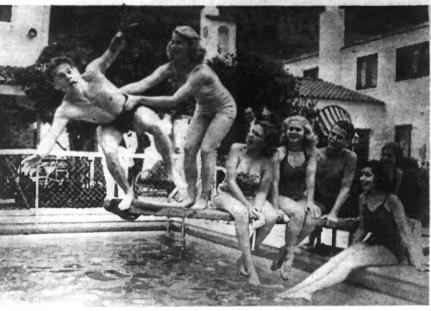
Pour fêter les seize ans de la jeune vedette Judy GARLAND, M. Louis B. MAYER, de la M.G.M., invitait dernièrement la jeune artiste et ses camarades de studio à une petite fête dans sa propriété de Santa Monica (Californie).