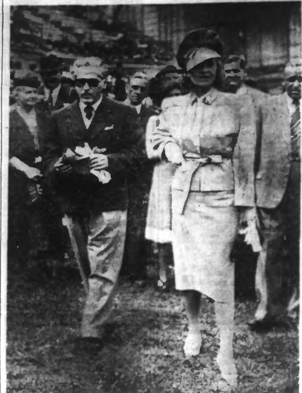
La Vedette de l'écran aperçue au passage du Champ de courses d'Auteuil. (Photo Henri Manuel).

« LE SAUVAGE » — La réalisation de ce film de la fin du mois de juillet, Bach s'en est engagé pour le rôle principal celui de « chasseur » (Fournier).