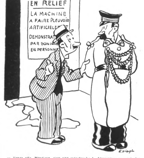
Venez vite, Monsieur, c'est une catastrophe... L'inventeur ne peut plus arrêter sa machine et l'eau emplit la salle.