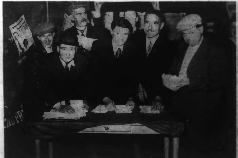
On sait que le billet gagnant des six millions du Sweepstake avait été vendu par dixièmes, par la société d'encouragement. Voici six des dix ouvriers d'une usine de FANTIN, gagnants d'un des dixièmes, venant toucher leur lot de 600.000 francs.