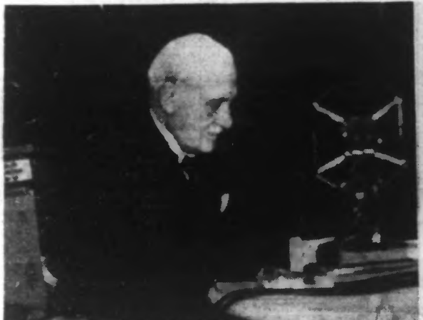
Une attitude du Président MOSCICKI, au micro