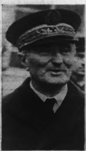
L'Amiral DARLAN. On sait que par un récent décret, le vice-amiral DARLAN, chef d'état-major général de la marine, prend rang d'amiral de la flotte.

Tokio, 29. — On mande de Tien-Tsin : Un renforcement du blocus des concessions anglaise et française de Tien-Tsin est annoncé pour le 1 er ou le 2 juillet.