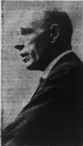
Une attitude le Lord HALIFAX (S.A.F.A.R.A.)

Londres, 29. — Dans un discours radio-diffusé en Angleterre et à l'étranger, prononcé ce soir au cours du neuvième dîner annuel de l'Institut royal des affaires internationales, lord Halifax a commencé par rappeler les grands changements survenus depuis le discours qu'il prononça il y a un an à la même occasion. « Il y a un an, a-t-il déclaré, nous n'avons pris aucun engagement spécifique sur le continent européen, au delà de ceux existant depuis un temps considérable, et qui nous sont à tous familiers. Aujourd'hui, nous sommes liés par de nouveaux accords de défense mutuelle avec la Pologne et la Turquie. « Nous avons garanti notre assistance à la Grèce et à la Roumanie en cas d'agression et nous avons entamé avec le gouvernement soviétique des négociations qui, je l'espère, pourront très prochainement être couronnées de succès, afin de l'associer à nous pour la défense des Etats d'Europe, dont l'indépendance et la neutralité peuvent être menacées.