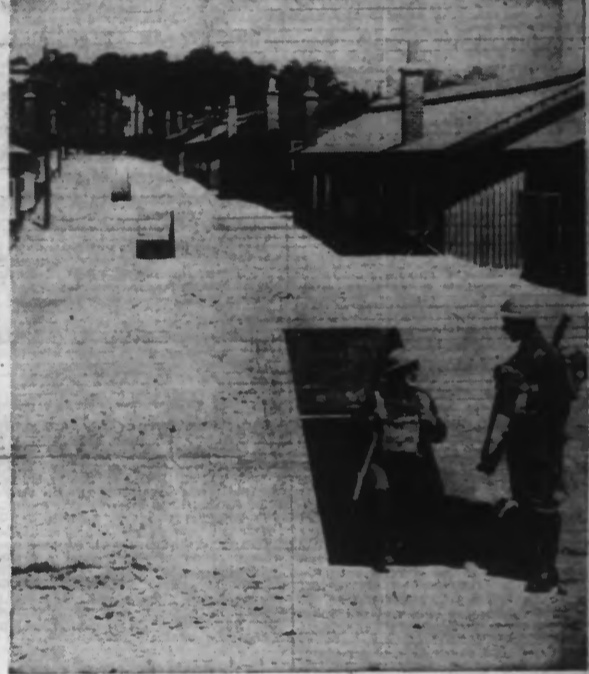
Plus de 1.000 abris en acier contre les attaques aériennes ont été construits au Camp d'ALDERSHOT, pour assurer la sécurité des 40.000 hommes de troupes qui s'y trouvent réunis presque constamment. Voici un aspect des abris.