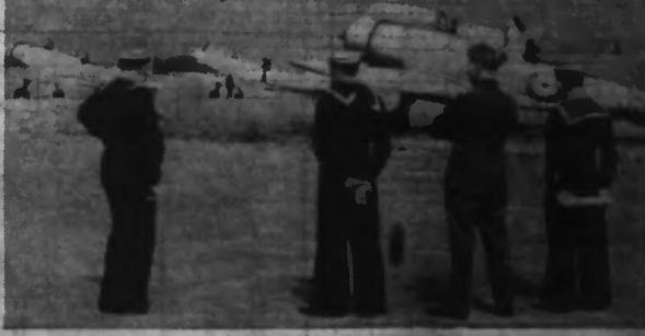
Les autorités navales britanniques viennent de présenter à la Presse la nouvelle station aéronautique pour la Marine à LEE-ON-SOLENT. Notre photo montre des avions « SEUA » sur le terrain de Lee-On-Solent.