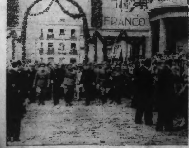
Poursuivant son voyage en Galice, le Généralissime FRANCO est arrivé à LUGO. Voici le Caudillo passant sous un arc de triomphe et acclamé par la population.