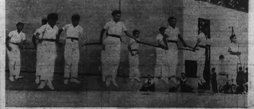
LES ENFANTS BASQUES EXÉCUTANT UNE DE LEURS DANSES.

Le chœur des enfants basques « Elai-Alai » se fera applaudir ce jour à Lille et demain à Roubaix