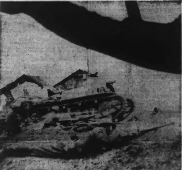
Au cours d'une marche sur une ville de la Chine Centrale, les anglais motorisés ont joué un grand rôle.

Les Japonais dont l'intransigeance semble croissante, ne paraissent pas disposés à desserrer le blocus des concessions