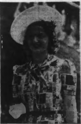
Une toilette originale qui reproduit les multiples étiquettes réclame de nombreuses marques de cigarettes. (S.P.A.R.A.)

LIRE EN HUITIÈME PAGE NOTRE PAGE FÉMININE