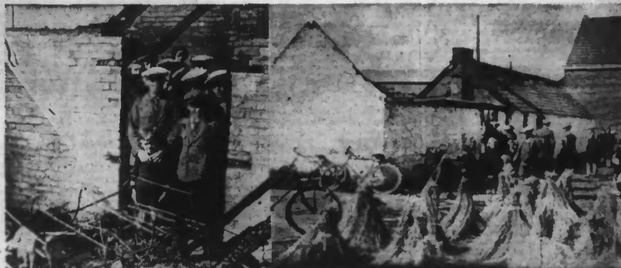
A GAUCHE : L'intérieur calciné de la chambre et le lit-cage sur les débris duquel on retrouva les cadavres des enfants. A DROITE : La maisonnette entourée de curieux.

Le feu qui a pris naissance dans des circonstances demeurées inconnues a entièrement détruit la maison qui les abritait