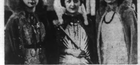
La Reine de l'Epeule et ses demoiselles d'honneur.

Les fêtes organisées par le Comité du quartier se sont déroulées, dimanche, dans l'ordre du programme. Une course cycliste de 60 kilomètres eut lieu le matin. L'après-midi, à 15 h, un cortège carnavalesque des plus intéressants défila sur les rues de l'Epeule.