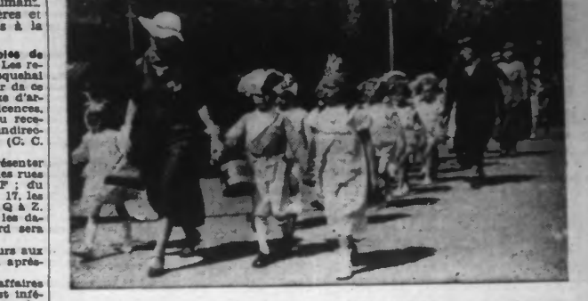
Un charmant groupe d'enfants costumés.

La deuxième journée de la fête des écoles s'est déroulée dimanche. Pendant que s'ouvrait au parc de l'Hôtel de Ville, la foire aux plaisirs, le cortège se formait rue Victor Hugo. Composés de la section cycliste des Sports Travailleurs, des écoles des filles Anatole France, Voltaire, de l'Harmonie Municipale de Croix, l'école de garçons de Hugo, l'Union chorale et le Cercle Symphonique, il se rendit à l'Hôtel de Ville.