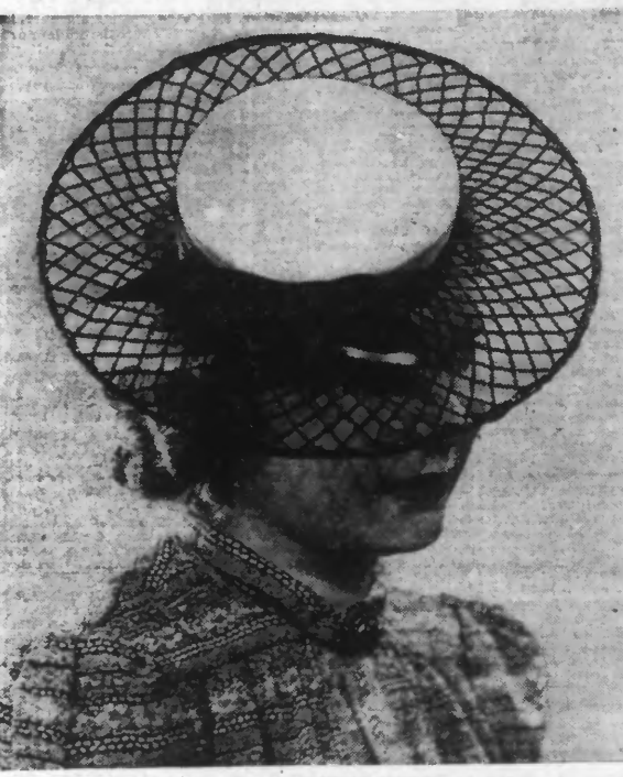
Le fond en joutre blanc, passe ajourée, noué pelours noir.

Si vous préférez vous pouvez remplacer la pâte brisée par une pâte boursgeoise.