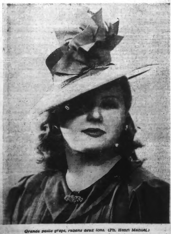
Grande paille grecque, rubans deux tons.

LE SECRET DE L'HARMONIE SEXUELLE est dévoué sans réserve aux adolescents, aux parents, aux époux dans trois livres retentissants, par un générique philanthrope universellement connu. Plus de 300 000 exemplaires distribués, 30 000 références. Cette offre humanitaire ne poursuit aucun but commercial et n'est en vue que le bien public. Coût total: 1 fr. de timbres (ou mandats) Etranger 10 fr. Publications W-H Baxter (S.R.N.S.) 200, boulevard Charvot, Marseille.