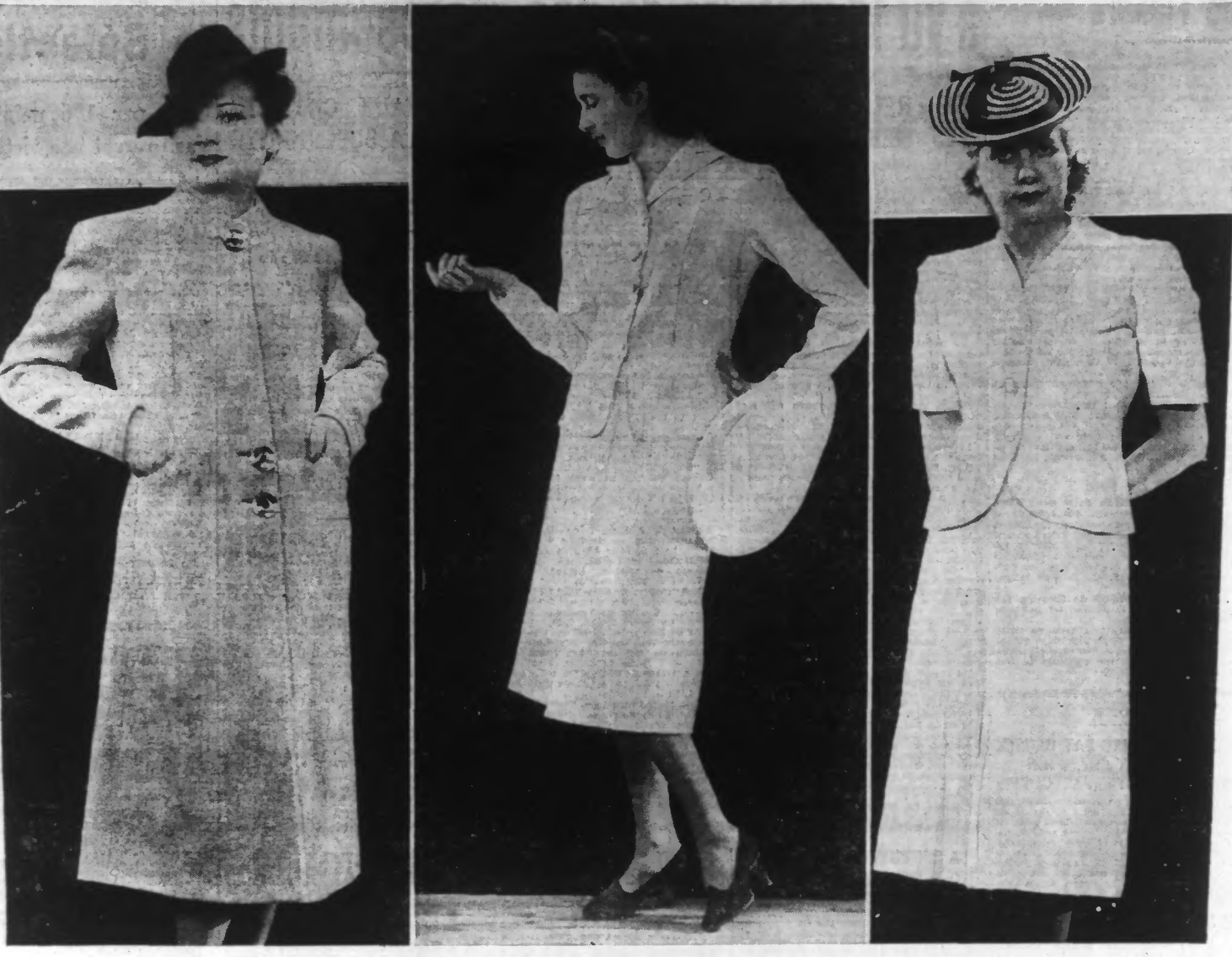
De gauche à droite: Manteau gris clair fermé par trois boutons fantaisie. — Tailleur blanc, plis creux dans la jaquette. — Tailleur tussor blanc, poches incurvées.

La femme vertueuse qui prend de la JOUVENCE DE L'ABBÉ SOURY conserve sa santé pendant toute sa vie.