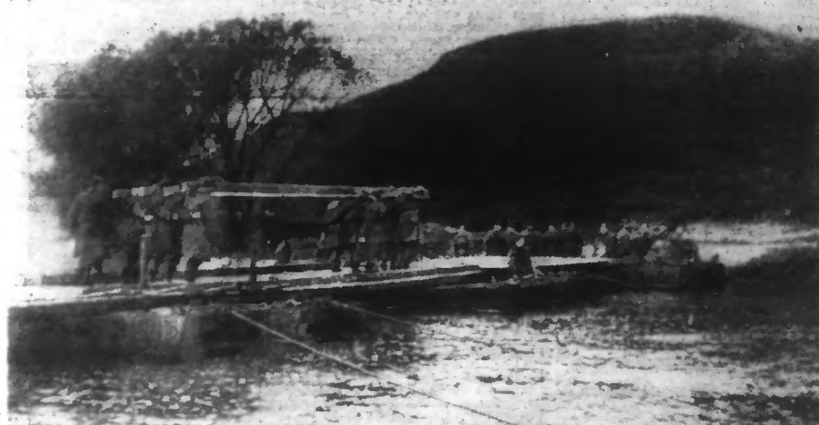
VOICI DES PONTONNIERS BELGES CONSTRUISANT UN PONT.