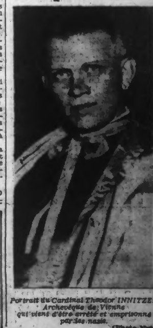
Portrait du Cardinal THEODOR INNITZER Archevêque de Vienne qui vient d'être arrêté et emprisonné par les nazis.

LIRE EN QUATRIEME PAGE Les textes des décrets sur : Le relèvement des soldes des militaires Les rapports entre bailleurs et locataires L'assouplissement de la taxe à la production