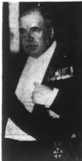
LORD DERBY pays en 1914 et aujourd'hui, mieux nous nous rendons compte de cette vérité.

EN 1939 Combien les choses sont différentes en 1939. Notre pays absolument unanime ; aucune nécessité de propagande pour le recrutement ; aucune nécessité de préparer le terrain à la conscription. La conscription ? nous y sommes venus avec regret en 1914. Elle a été acceptée de tout cœur, lorsque nous nous préparions à la guerre actuelle. Voilà ce que tout le monde reconnaît en France et c'est une raison de confiance de plus. Personne ne peut mettre en doute la sincérité de nos deux pays ni leur volonté absolue de se tenir côte à côte et de combattre jusqu'à la fin pour une cause qui leur est commune. Vous n'avez qu'à lire les discours de notre premier Ministre Mr. CHAMBERLAIN et de M. DALADIER en France pour vous rendre compte combien ils travaillent en étroite collaboration et combien ils sont appuyés de tout cœur par leurs pays. Dans notre pays, Mr. CHAMBERLAIN a notre confiance la plus absolue, et je suis convaincu que la même chose est vraie pour M. DALADIER en France.