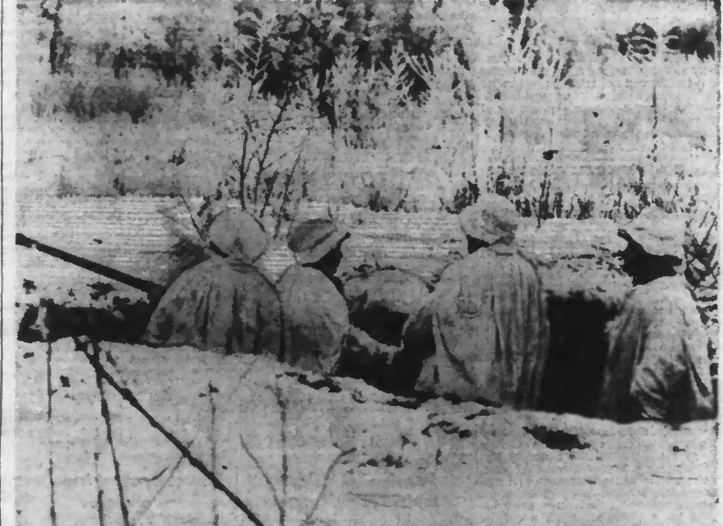
Soldats finlandais équipés pour la guerre dans la neige et installés dans une tranchée avec leurs armes automatiques. (Photo Kayton. — 31.005.)

Par un froid de — 30° d'importants raids de l'aviation rouge n'ont causé que peu de victimes et de faibles dommages