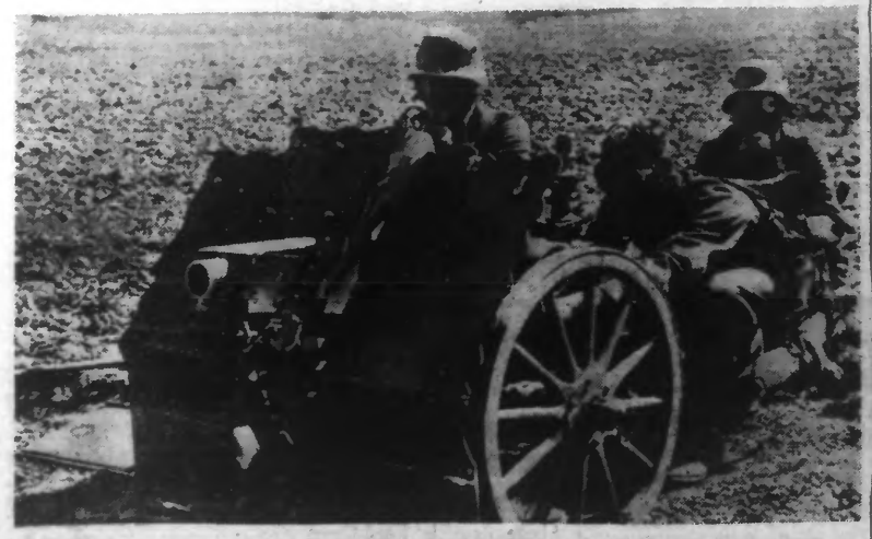
« MINENWERFER » ALLEM. ND (CANON DE TRANCHEE), EN POSITION DE COMBAT. (A. A. 41.)

CES ATTAQUES ONT ÉTÉ REPOUSSÉES APRÈS D'ASSEZ VIFS COMBATS D'INFANTERIE