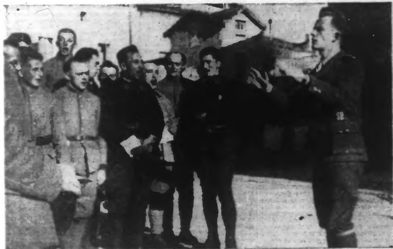
La chorale d'un régiment tchécoslovaque répétant dans la cour de sa caserne.

(D'UN DE NOS ENVOYÉS SPÉCIAUX) D'UN CAMP DES FORMATIONS TCHÉCOSLOVAQUES. — DÉCEMBRE. — Dans les premiers jours de Septembre, à travers les plaines et les montagnes, un long convoi roule. Il emporte des hommes qui ont fait le vœu de reconquérir leur liberté et leur patrie. Ce sont les volontaires de l'armée tchécoslovaque reconstituée en terre française.