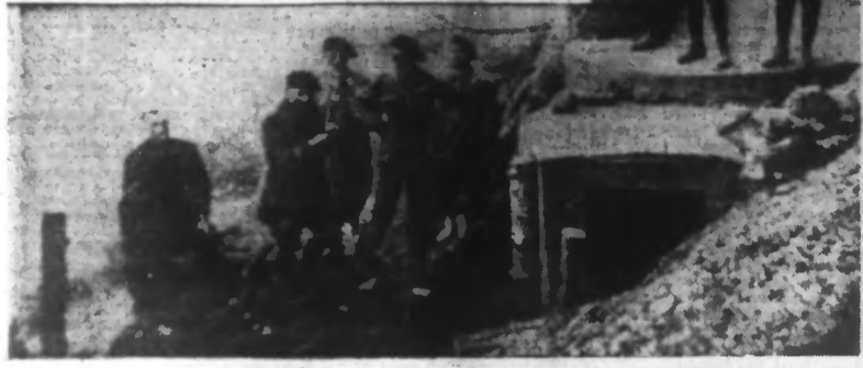
CHASSEURS ALPINS EFFECTUANT DES TRAVAUX DE DÉFENSE EN HAUTE MONTAGNE