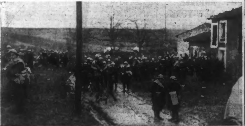
HALTE-REPOS D'UN RÉGIMENT MONTANT EN LIGNE (Photo Safara. — 27.192)

Leur effectif est de même importance que celui constaté lors de la période critique du début de Novembre