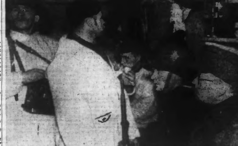
Soldats finnois écoutant dans un abri souterrain les nouvelles par T. S. F. en attendant d'aller relever leurs camarades au combat. (Photo Safara. — 31.770)

La pénétration soviétique se trouve fortement ralentie, sinon stoppée, et les pertes sont de plus en plus lourdes dans les rangs de l'armée rouge