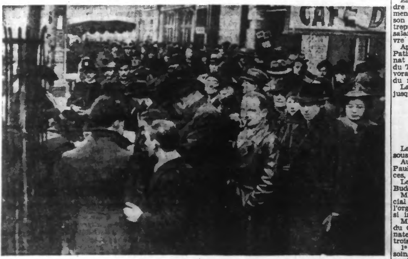
L'animation est grande autour des baraques et des camelots qui se sont installés, comme chaque année, sur les trottoirs des grandes artères parisiennes.

Le commerce des petites baraques installées sur les trottoirs des boulevards de Paris, bat son plein.