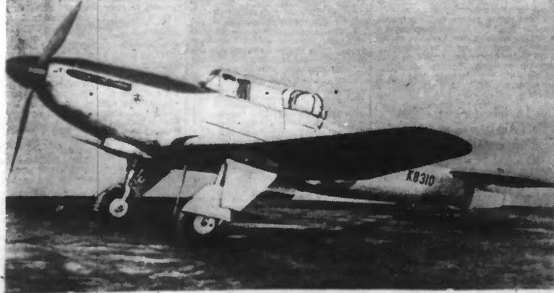
C'est le « DEPIANT » qui vient d'être mis en service par la « Royal Air Force ». Cet appareil est si rapide qu'il inquiète beaucoup les Allemands qui n'ont pas de modèle semblable à lui opposer. (Photo Keystone. — A. 2271).