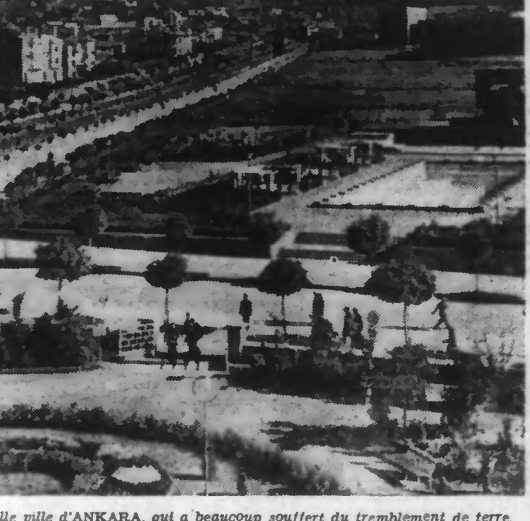
Une vue partielle de la nouvelle ville d'ANKARA, qui a beaucoup souffert du tremblement de terre.

Ankara, 29. — Les dernières nouvelles démontrent que le tremblement de terre d'Anatolie centrale et orientale a été malheureusement une très grande catastrophe. Le nombre de tués et des blessés n'est pas encore déterminé de façon précise, mais il dépasse certainement quelques dizaines de mille. Le reste de la population est sans abri, sans soutien, sans nourriture, exposé à toutes les rigueurs d'un hiver particulièrement rude dans ces parages, où le thermomètre baisse fréquemment jusqu'à 30°. L'épicentre du cataclysme paraît être Erzinjan, vieille ville détruite déjà en 1784 par un séisme et qui a été, cette fois complètement rasée à nouveau. Dans cette ville de 16.000 habitants, il n'y a plus aucune maison debout, sauf une grande caserne. La majeure partie des habitants ont été tués ou blessés par suite de l'heure tardive à laquelle se produisit le séisme et qui trouva tous les habitants au lit. La petite ville de Zara a également beaucoup souffert. Mille maisons ont été détruites et l'on compte 1.500 morts. Le gouvernement a pris immédiatement des mesures énergiques pour venir en aide aux sinistrés.