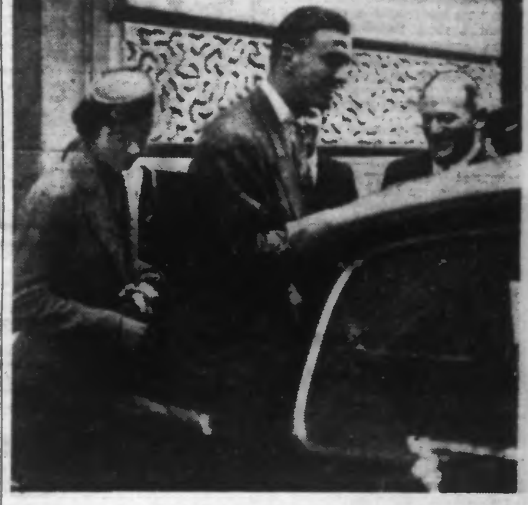
M. Franklin-D. ROOSEVELT et sa femme, montant en voiture. (A. A. 134).

Portant de graves blessures à la tête, tous deux ont été admis à l'Hôpital de Winchester