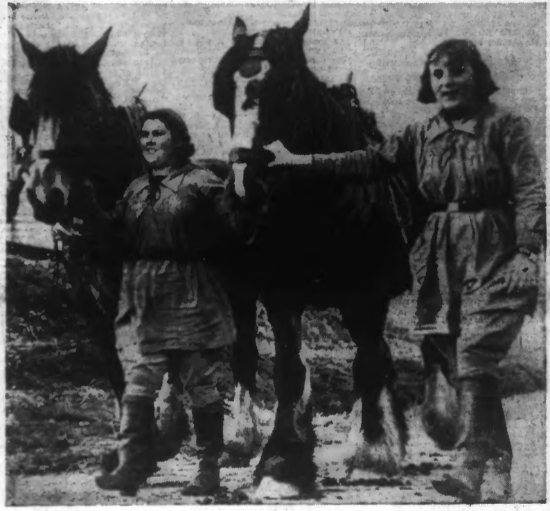
JEUNES PAYSANNE REGAGNANT LA FERME AVEC LEURS COMPAGNONS DE TRAVAIL.