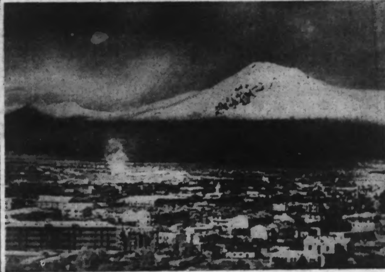
La région d'ERIVAN avec, dans le fond, le MONT ARARAT qui a particulièrement souffert du séisme.

De nombreuses habitations se sont écroulées et les dégâts sont énormes dans les régions de Smyrne, Ismidt, Brousse, Manissa, centres paraissant les plus éprouvés