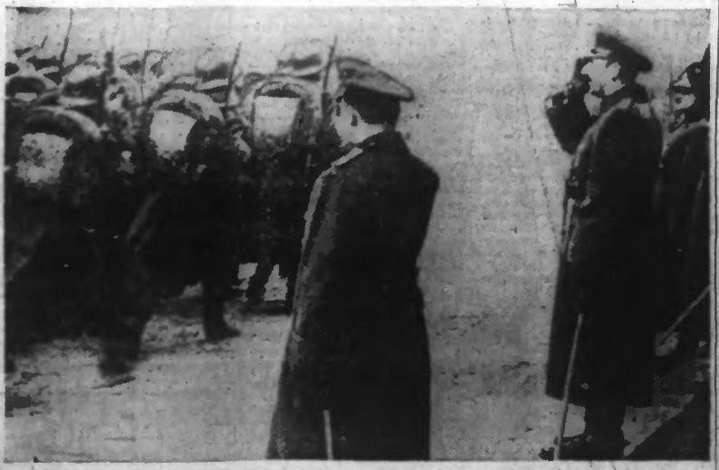
Le roi BORIS de Bulgarie, passe en revue les recrues engagées pour le service spécial de 75 jours. (Photo Keystone. — 34.629)