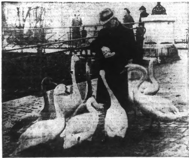
Voici revenu l'hiver et la période de diète pour les gracieux volatiles qui peuplent les lacs suisses. Aussi, les cygnes ont-ils pris l'habitude de venir manger dans les mains des passants charitables, chose très rare de la part de ces oiseaux fiers et sauvages.