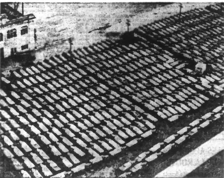
Un lot imposant de camions prêts à être embarqués dans un port américain, à destination de la France et de l'Angleterre. (Photo N.Y. — 32.800).