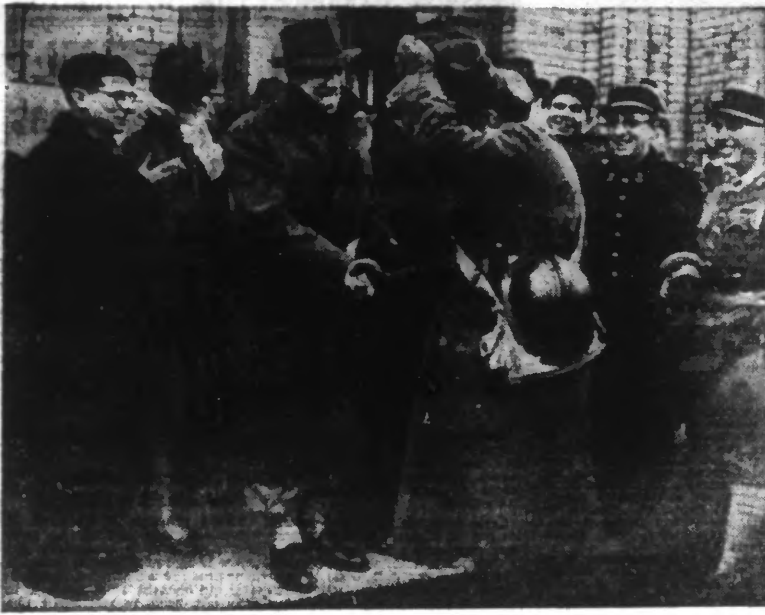
Tout le monde « rigole » en voyant arriver le joyeux FERNANDEL. (Photo Safara. — 34.229).