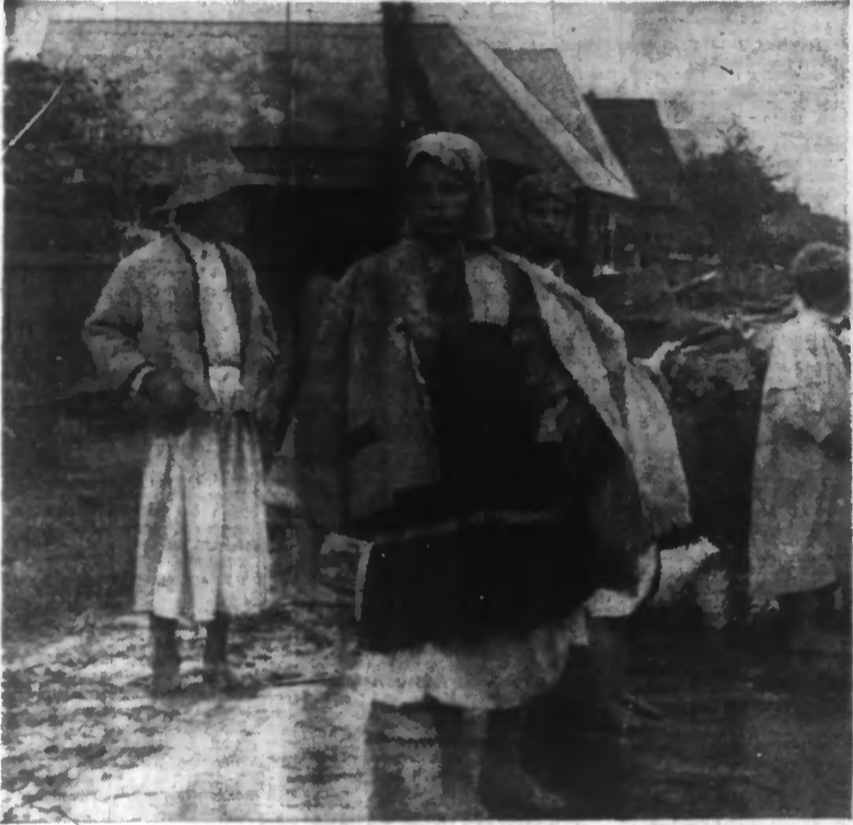
GRUPE D'ENFANTS DANS UN KOLKOSE.

Les paysans finlandais, dont la résistance étonnante le monde civilisé, savent bien pourquoi ils se battent : Ils veulent préserver leurs traditions, leur existence familiale, leurs biens individuels, leur régime social