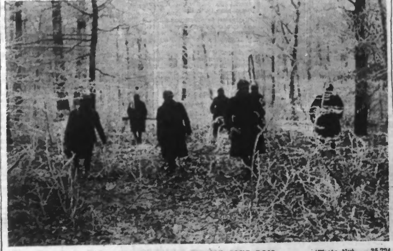
PATROUILLE FRANÇAISE SOUS BOIS

Une patrouille française a pénétré à l'intérieur des lignes ennemies sur une profondeur de 2 à 3 kilomètres