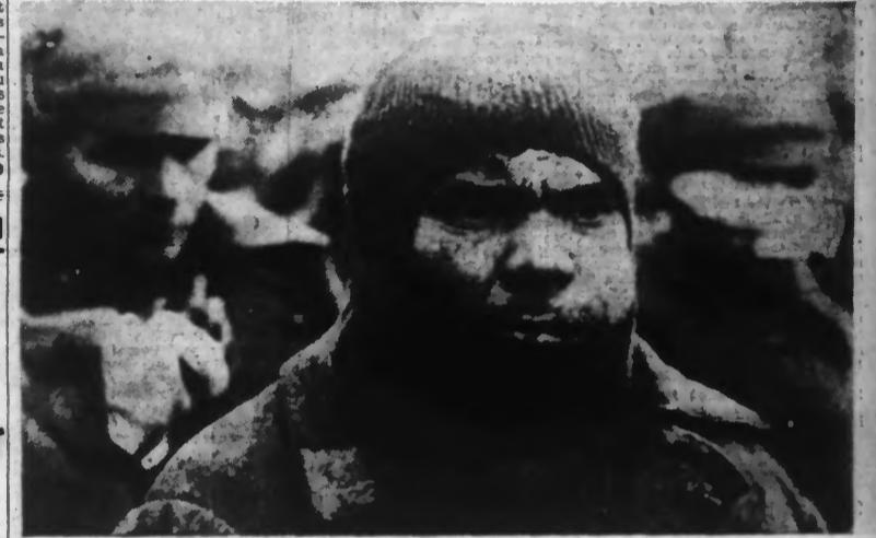
UN TYPE DE PRISONNIER RUSSE PARMIS LES BLESSÉS EN CARELIE (Photo Safara - 35.304)

Stockholm, 4. — Deux divisions russes seraient sur le point d'être encerclées dans la région d'Aglaajaervi, déclare le correspondant en Finlande.