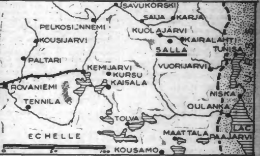
CARTE DES OPERATIONS DANS LA REGION DE SALLA (A.A. 189)

Une dizaine d'avions soviétiques ont été abattus par l'aviation de chasse et la D. C. A. finlandaises