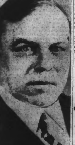
M. MACKENZIE KING, Premier Ministre du Canada.