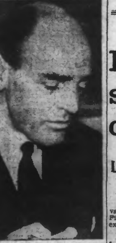
Sir JOHN REITH qui dirigera désormais le ministère britannique de l'Information.

Pour important qu'il soit, ce changement de titulaire du War Office est donc ramené aux justes proportions d'un événement de politique intérieure qui paraît avoir plus de rapports avec la psychologie qu'avec l'art de la guerre. Aussi ne s'attend-on pas que le chef du gouvernement donne à d'autres qu'aux membres du Parlement les raisons qui ont dicté sa décision. (Lire la suite en deuxième page)