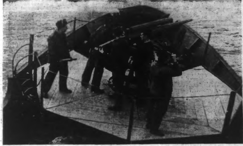
Un bateau de pêche armé en dragueur de mines, a reçu également un canon, afin de se défendre contre les sous-marins. (Photo Safara. — 25.559)

Pour Sir Julian Corbett, l'historien officiel de la marine, écrit à propos de la guerre de 1914-1918 : Face à face avec un combat dont la gravité fut rapidement reconnue, le pays non seulement revint à cet esprit du moyen âge, duquel est née sa puissance sur mer, mais il lui a insufflé une énergie nouvelle, l'a doté d'une méthode moderne. Toute la population dont la vie dépend de la mer, pour autant qu'elle n'était pas indispensable pour d'autres travaux d'une importance essentielle pour la vie nationale a rallié le front du combat, six mois à peine après le début de