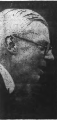
M. OLIVER STANLEY, le nouveau Ministre de la Guerre de GRANDE-BRETAGNE. (Ph. Keystone. — 27.152)

Celui-ci reste entièrement déterminé, en étroit et complet accord avec la France, à employer toutes les ressources du pays en vue d'une victoire totale sur l'ennemi commun