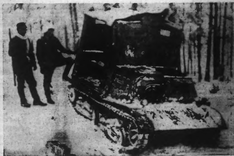
Est-ce une guimbarde ? Non, un des nombreux tanks au service de la fameuse armée « fabriquée » par STALINE, que les Finlandais capturèrent au cours de leur dernière grande victoire de SUOMUSSALMI.

Tel serait le bilan tragique des pertes russes depuis le début de la campagne contre le vaillant et héroïque peuple finnois.