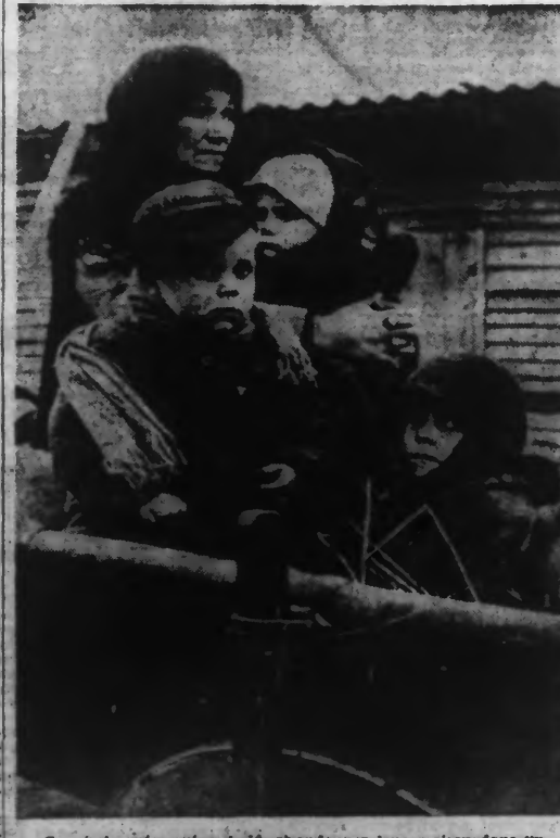
Ces émigrants, qui ont dû abandonner leur maison dans un des pays baltes pour rentrer au « bercail » hitlérien, n'ont pas l'air particulièrement heureux.