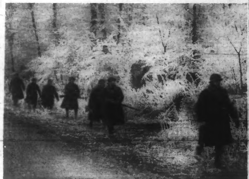
Patrouille le long d'un bois, se rendant à son emplacement de départ pour tenter le « coup de main » préparé préalablement avec minutie. (Photo Nyl - 35.718.)

Elle s'applique aux Lundis, Mardis et Vendredis Dans les restaurants et tous lieux de consommation, le plat unique de viande est institué LIRE NOTRE INFORMATION EN « DERNIERE HEURE »