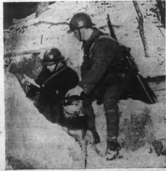
EN PREMIERE LIGNE, ON PREND CONNAISSANCE D'UN MESSAGE APORTE PAR UN CHIEN DE LIAISON. (Lire notre information en 2 e page)

Deux avions ennemis ont été abattus dans nos lignes par des chasseurs français