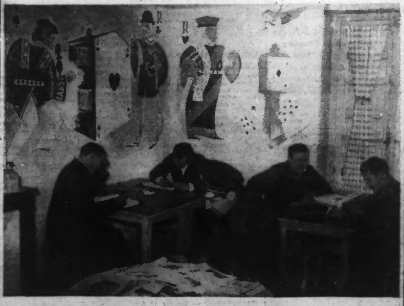
...où les aviateurs français passent agréablement leurs heures de loisir, ainsi qu'en témoigne la décoration murale faisant honneur au feu de carles. (Photo NYT. — 37.804).