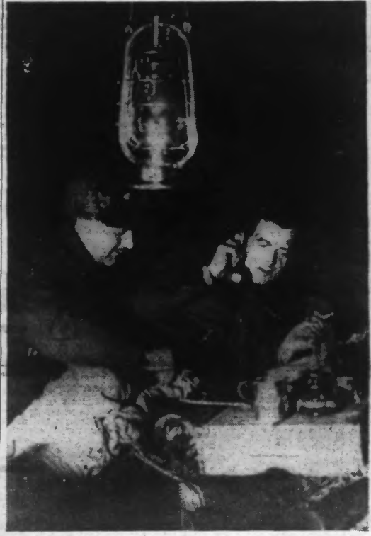
Sous sa tente, le commandant d'une armée finlandaise donne ses instructions par téléphone. (Ph. Keystone. — 38.178).