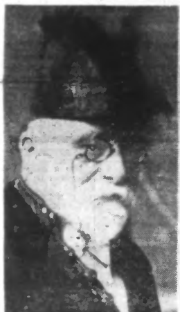
...qui vient d'être élu Secrétaire perpétuel de l'ACADEMIE FRANÇAISE. (Photo Keystone. — 39.088).