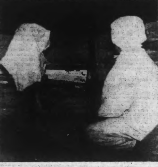
Dans un aéro-poste, un gendarme finlandais dans son costume blanc de neige, est à l'écoute. Il a, toutefois, pris la précaution de fabriquer une silhouette du même genre, pour se pas être victime de la fusillade de l'ennemi.

Stockholm, 13. — La bataille engagée à Salla et dont les communiqués officiels s'abstiennent de parler encore, est au centre de l'attention des milieux politiques suédois. Selon certaines rumeurs, les troupes finlandaises auraient peut-être réussi à encercler une division russe, mais les Soviétiques paraissent décidés à empêcher coûte que coûte la réédition du désastre de Suomusalmi.