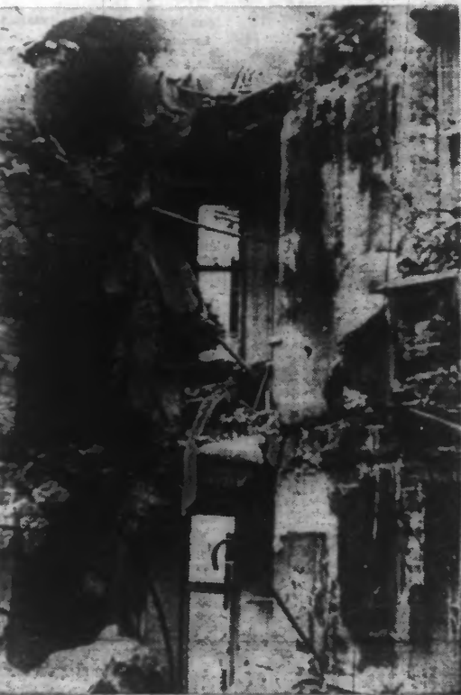
Dès la rupture des relations diplomatiques avec la FINLANDE, STALINE faisait bombarder avec une sauvagerie inouïe la capitale finnoise : HELSINKI. — Voici une maison complètement anéantie après un des premiers raids meurtriers de l'aviation soviétique. (Photo Keystone. — A. 2.370.)

Pour bien comprendre les sentiments qui inspirent l'héroïque résistance des Finlandais, il est indispensable de connaître la situation morale et psychologique de ce pays dans les années qui précéderont son invasion. L'occupation russe en Finlande pendant plus d'un siècle avait laissé de cruels souvenirs. Mais ceux de la guerre civile fomentée dès 1918 par la Russie soviétique étaient encore plus proches. De sorte que les rapports entre les deux pays, bien que corrects, étaient plutôt froids. Par contre les Finlandais avaient une prédilection pour l'Allemagne, pour sa culture, sa langue qui, après le finnois et le suédois, était la langue étrangère la plus répandue dans les milieux officiels. C'est que les Finlandais n'avaient pas oublié le service rendu en 1918 et le sang allemand versé pour la cause de leur indépendance. Et leur fervor à fleurir chaque jour les tombes des soldats allemands morts sur leur sol et l'aide aux enfants allemands apportée après 1919 à l'Allemagne vaincue. L'avènement de Hitler ne modifia en rien l'attitude des Finlandais à l'égard des Allemands. Le peuple finnois n'a pas peur de la dictature, du fait qu'il ne la comprend même pas. Il pousse l'esprit démocratique très loin et jusqu'à l'extrême tolérance. Il y a sans doute chez lui comme partout ailleurs des nationalistes qui rêvent d'une plus grande Finlande et qui admirent Hitler, mais pour l'immense majorité la seule vérité politique est : La Finlande aux Finlandais.